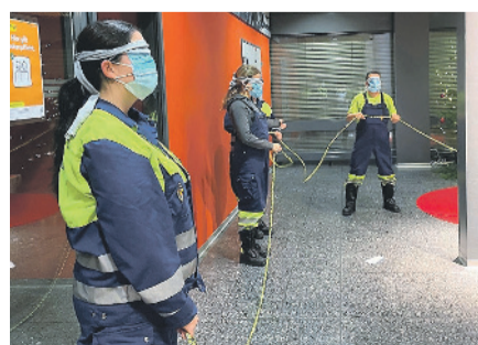
Die Teilnehmenden versuchen mit verbundenen Augen den Anweisungen ihrer Gruppenführenden zu folgen und mit dem Seil ein perfektes Quadrat zu formen.

Für die Rallye wurden fünf verschiedene Posten auf dem Stadtgebiet aufgestellt, die von Mitarbeitenden der Stadtverwaltung betreut wurden. Beim Absolvieren der Posten stand aber nicht nur der Spass im Vordergrund, bei den vielseitigen Herausforderungen wurden zusätzlich die Geschicklichkeit, Teamfähigkeit und die Kommunikation der Anwesenden geschult. Die Teilnehmerinnen und Teilnehmer mussten sich beispielsweise gegenseitig mit verbundenen Augen durch einen Parcours führen oder ein rohes Ei so verpacken, dass es einen Sturz unbeschadet übersteht. Auf diese Weise können jeweils wichtige Eigenschaften spielerisch erprobt und trainiert werden.