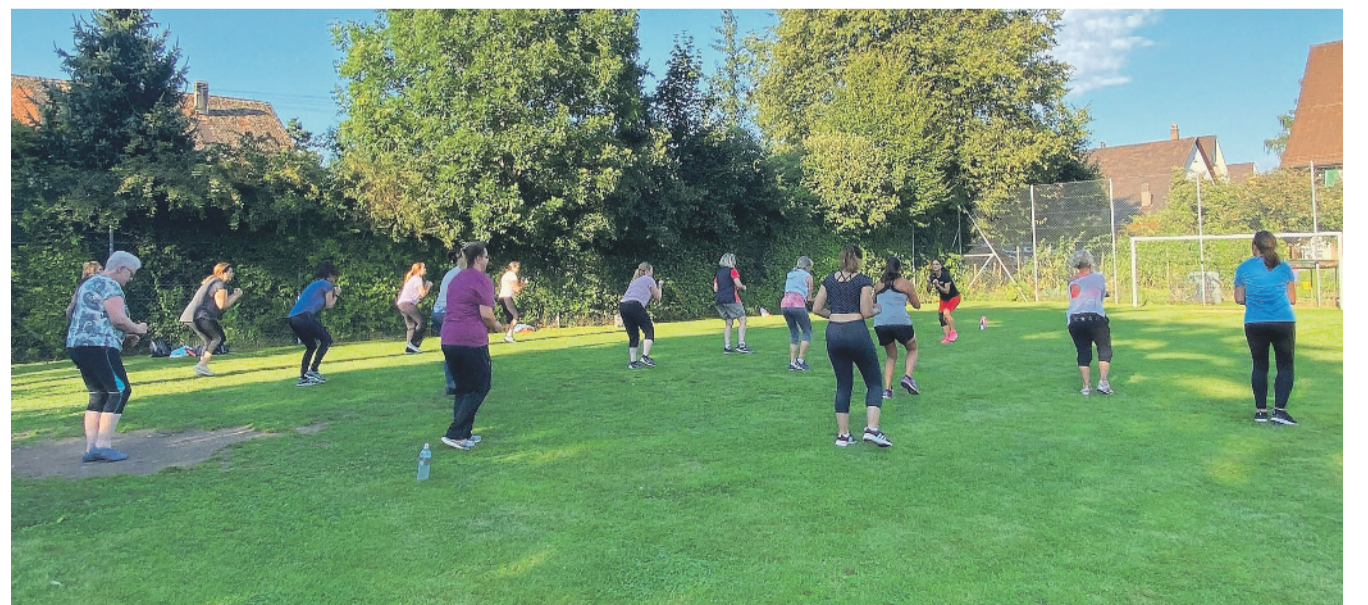
Motivierte Teilnehmerinnen und Teilnehmer bei Active City im Sommer 2021.

Um alle Informationen zu gegebener Zeit zu erhalten, besteht auf www.activecity.ch die Möglichkeit sich für den Newsletter anzumelden.