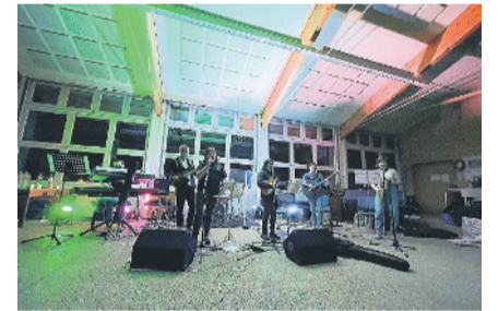
Mit viel Begeisterung wurde fleissig geübt am Schnupper-Day.