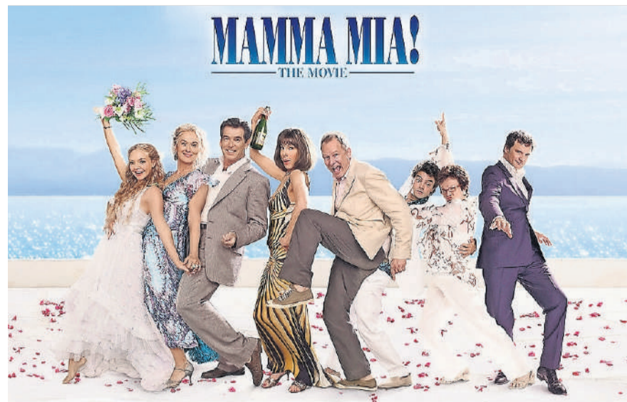
Zu geniessen unter freiem Himmel – «Mamma Mia!»

Der Film beginnt, wenn es dunkel wird um 21 Uhr. Da Meryl Streep auch singen kann, spielt sie die Hauptrolle der alleinerziehenden Mutter Donna in dem Film-Musical «Mamma Mia!». Regisseurin Phyllida Lloyd, die sich hauptsächlich als Opernregisseurin einen Namen gemacht hat, und Drehbuchautorin Catherine Johnson waren bereits für die Bühnenversion des Musicals mit 22 Abba-Songs verantwortlich. Donna lebt mit ihrer 20-jährigen Tochter Sophie auf einer kleinen griechischen Insel und betreibt dort eine Taverne. Sophie möchte Sky, ihre grosse Liebe, heiraten und träumt davon, von ihrem Vater zum Altar geführt zu wer-