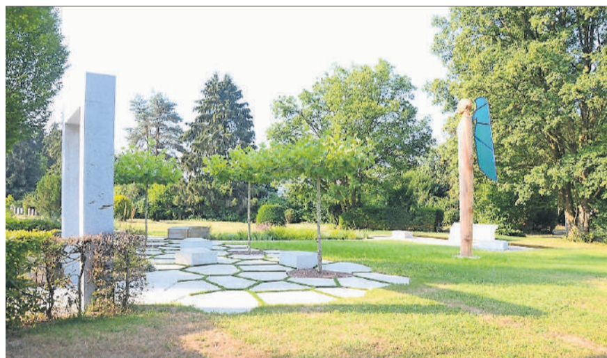
Das neue Kindergrabfeld mit Wasser- und Kunstelementen.