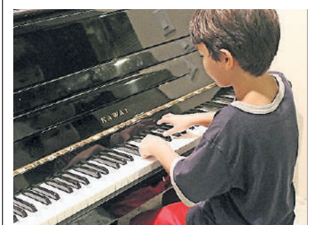
Am Musikschultag ist Ausprobieren ausdrücklich erlaubt.

Weitere Informationen: www.musikschule-kloten.ch