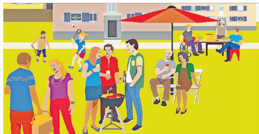
freiwillig@kloten schafft Begegnungen – in allen Quartieren.

Die Idee ist, dass am 29. Mai 2020, dem offiziellen «Tag der Nachbarn», in verschiedenen Quartieren von Kloten Begegnungen stattfinden, vom Spielnachmittag über die Plauderstunde bis zum Grillplausch, vom Filmabend über die Quartierbar bis zum gemeinsamen Turnen oder Joggen – der Phantasie sind wenig Gren-