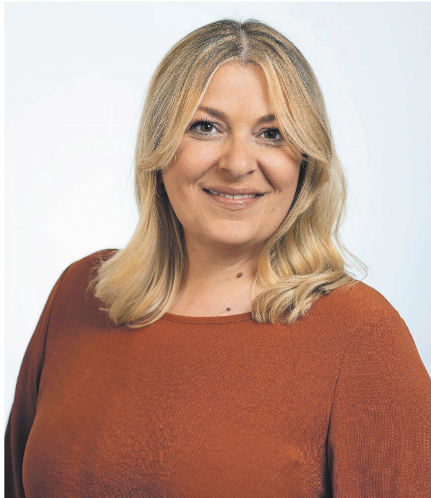
Hata Kiyauman informiert, koordiniert und unterstützt bei Fragen und Anliegen rund um das Alter.

Das ist ganz unterschiedlich. Ist es eine reine Informationsberatung zu einem gezielten Thema und die betreffende Person möchte oder kann danach alles alleine weiterregeln, ist oftmals nur ein Termin notwendig. Im Alltag erlebe ich jedoch häufiger, dass die Menschen zu lange warten, bis sie sich Hilfe holen. Je nachdem, zu welchem Thema Hilfe benötigt wird, kann eine Beratung auch über einen längeren Zeitraum andauern. Oftmals sind hier auch Abklärungen notwendig oder weitere Anlaufstellen involviert. Seniorinnen und Senioren, Angehörige oder andere Dienstleister wie Nachbarinnen/Nachbarn können sich mit ihrem Anliegen via Telefon oder Mail für einen Ter-