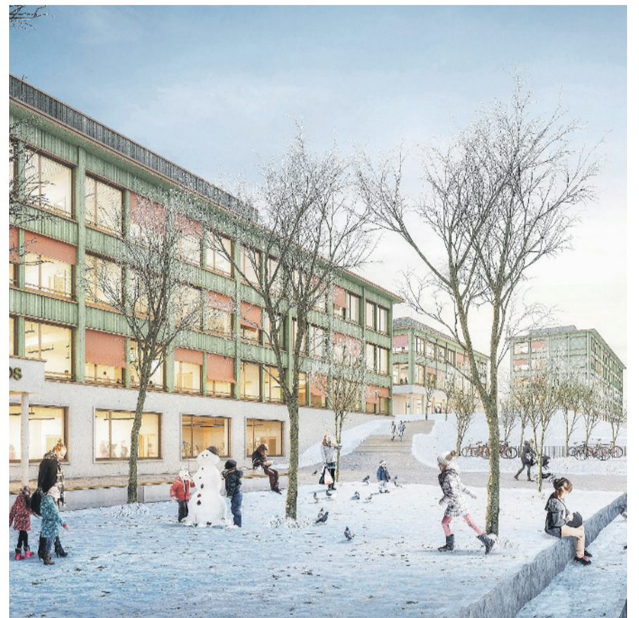
Visualisierung «Das fliegende Klassenzimmer» der Galli Rudolf Architekten AG ETH BSA.

Wann: Dienstag, 12. April, 18.30 Uhr und Mittwoch, 4. Mai, 18.30 Uhr Wo: Singsaal Schulhaus Nägelimoos (Gebäude Sekundarstufe)