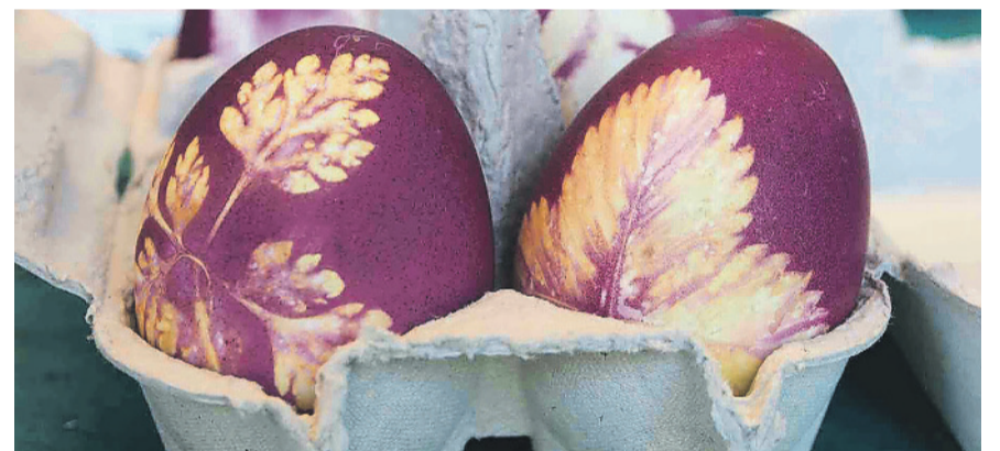
Am VFK-Bastelnachmittag können Alt und Jung gemeinsam Osterdekorationen basteln.

Weitere Informationen: www.vfk-kloten.ch