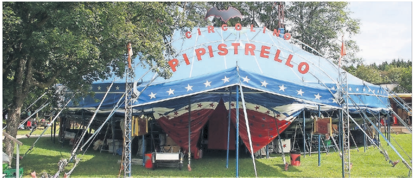
Das Zelt vom Circolino Pipistrello steht wieder im Freibad für die Klotener Kinder bereit.

Die Projektwoche mit dem Circolino Pipistrello wird für alle Klotener Kinder von der 1. bis 6. Klasse angeboten und findet dieses Jahr von Montag, 13., bis Samstag, 18. August, statt. Nach einem Schnuppermorgen am ersten Tag können die Kinder entscheiden, in welcher Disziplin sie sich während der Woche vertiefen wollen.