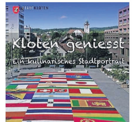
«Kloten geniesst» widerspiegelt die Fülle an Kultur und Geschmack von Menschen aus Kloten.

Informationen zu dieser und anderen Veranstaltungen auf dem Stadtplatz sowie zum Kochbuch erhalten Sie beim Zentrumsmanagement der Stadt Kloten: 044 815 12 93, stadtplatz@kloten.ch