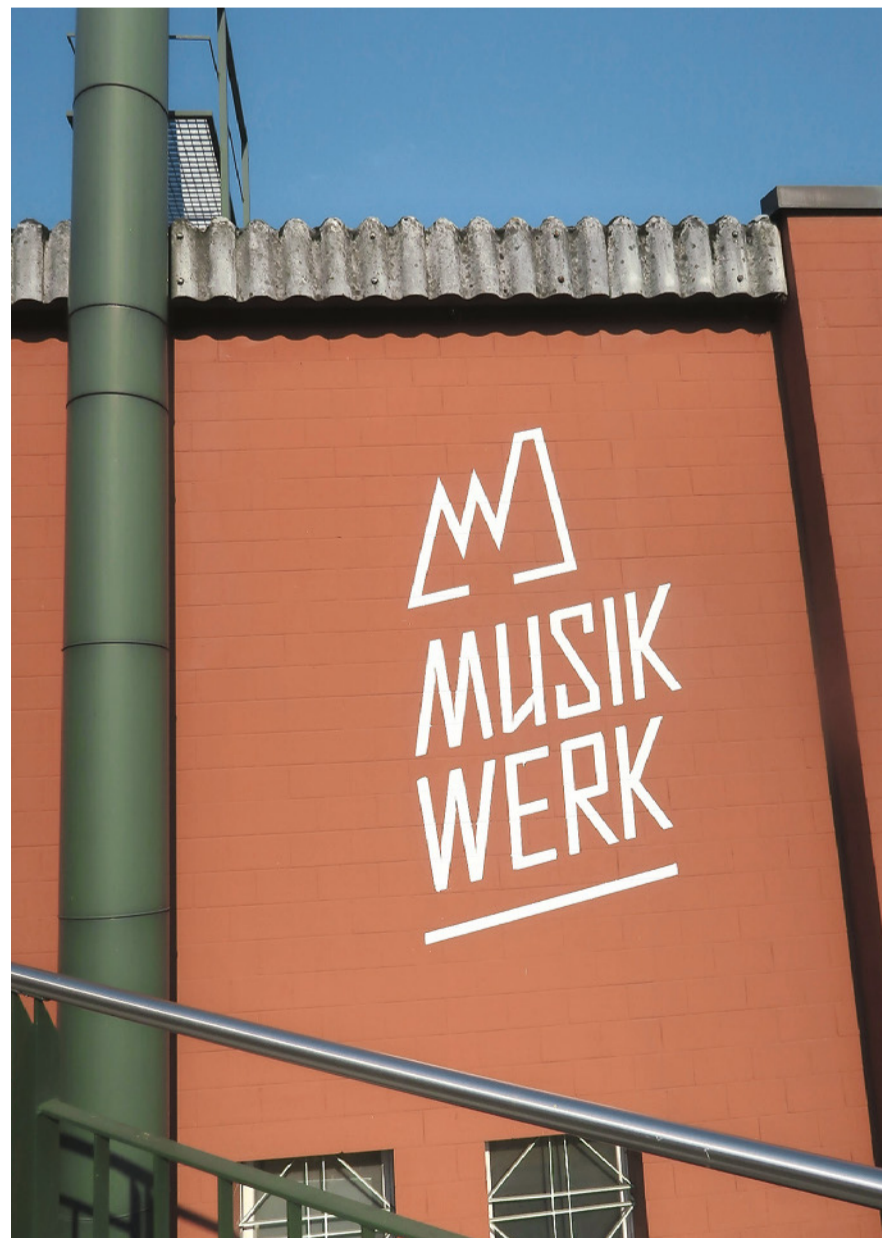
Willkommen am Musikschultag 2021.

Weitere Informationen: www.musikschule-kloten.ch