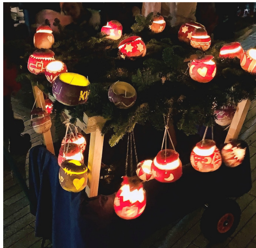
Leuchtende Räben werden durch Kloten ziehen. BILD STADT KLOTEN

Weitere Informationen: Detaillierte Pläne und technische Informationen werden mit der amtlichen Publikation vom 28. Oktober 21 auf https://www.kloten.ch/politikinformationen zur Verfügung gestellt.