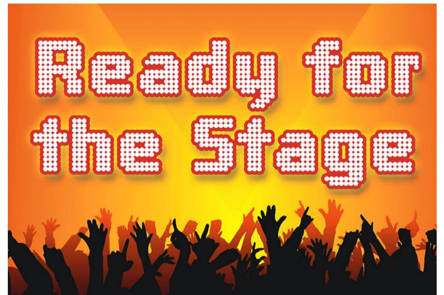
Schnuppertag an der Musikschule.