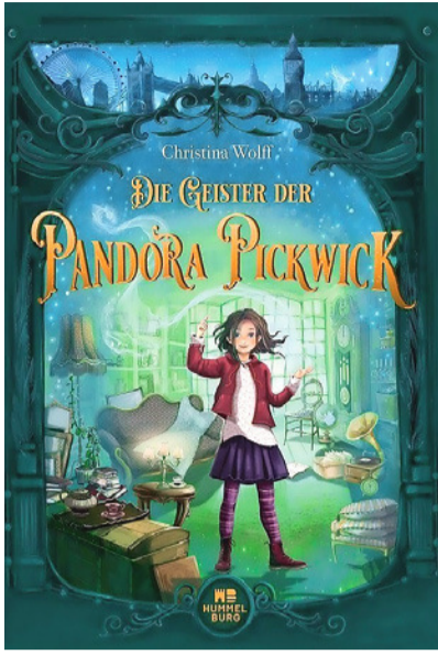
Turbulent und humorvoll: Kindergeschichte von Christina Wolff.