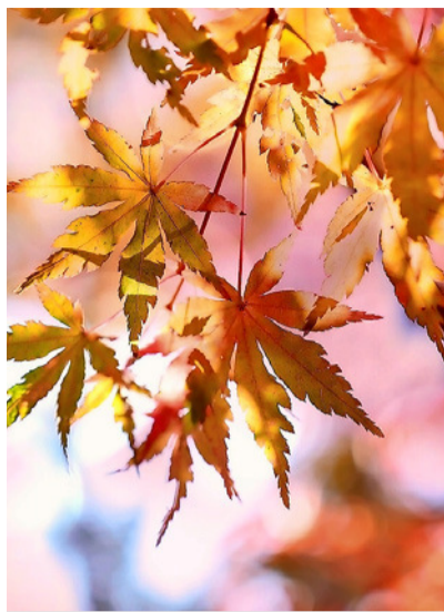
Es herbstet – Zeit für das traditionelle Herbstfest.