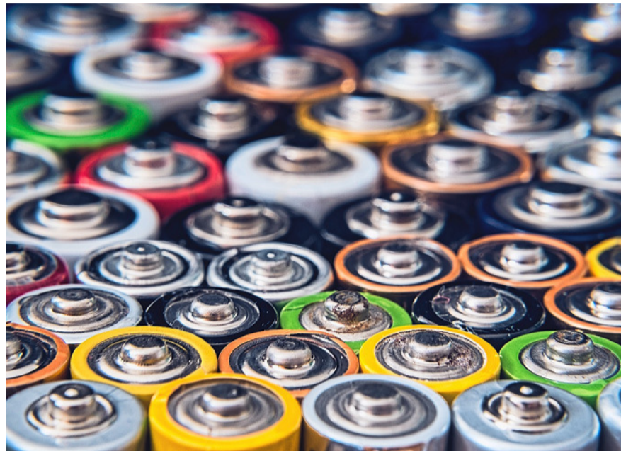
Batterien und Akkus müssen richtig entsorgt werden.

Weitere Informationen: www.kloten.ch/entsorgungrecycling