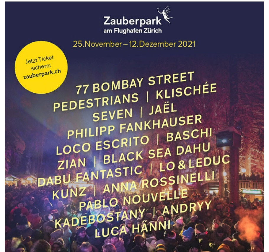
Der Flughafen wird zum Festivalort.

Weitere Informationen: www.schulekloten.ch