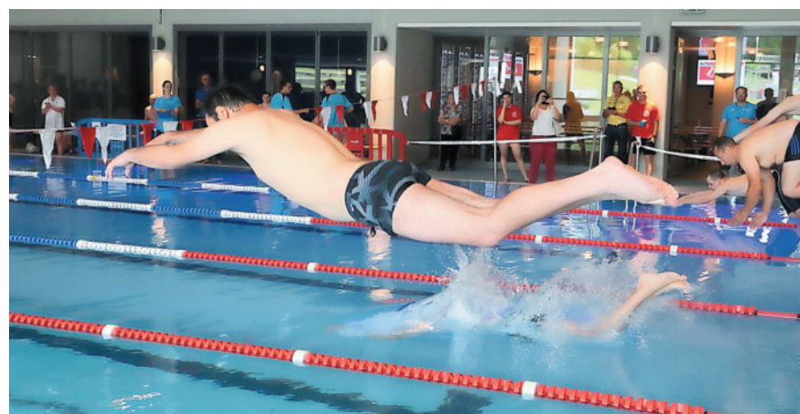
Am 19. November findet ein Wettkampf für Menschen mit geistiger Behinderung statt.