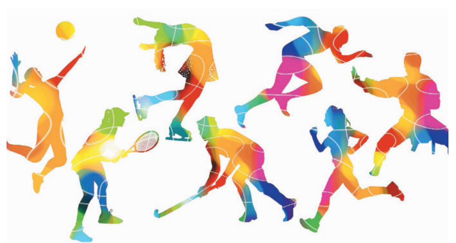
Jedes Jahr werden die erfolgreichsten Klotener Sportlerinnen und Sportler geehrt.

Im Rahmen des Jubiläums «40 Jahre Ludothek Kloten» findet am Dienstag, 8. November 2022, ab 19 Uhr in der Ludothek (Zentrum Schluefweg) ein Spielabend für Erwachsene statt. Unter dem Motto «Spiele – einst und jetzt» werden alte und neue Gesellschaftsspiele unter Anleitung der Ludothekarinnen gespielt. «Eile mit Weile» und «Elferspiel», «Scrabble» und «Master Mind», welche schon zu Anfangszeiten der Ludothek aktuell waren, und neue Spiele des Jahrgangs 2022 wie «Cascadia», «Rapido», «Family Inc.», «Cu-