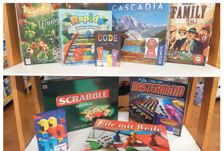
Spiele von einst und jetzt erwarten die Besucherinnen und Besucher des Spielabends am 8. November in der Ludothek Kloten.