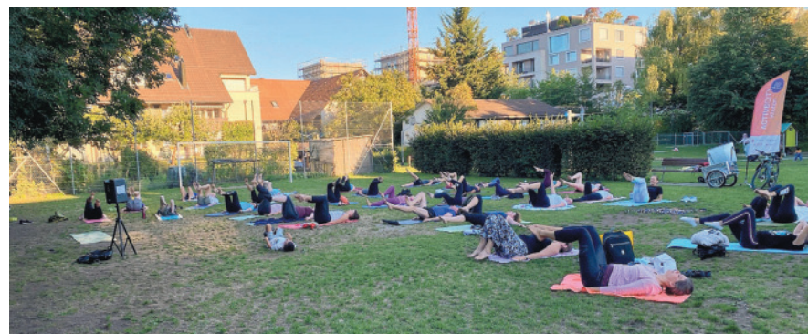
Pilates war eines der diesjährigen Highlights.

Im Hallenbad Schluefweg findet am Samstag, 19. November, ein Wettkampf für Menschen mit einer geistigen Behinderung statt, organisiert durch den WSKK. Hallenbad, Sauna und Massage sind den ganzen Tag für die Öffentlichkeit geschlossen. Die Stadt Kloten wünscht allen Schwimmerinnen und Schwimmern viel Erfolg und viel Spass.