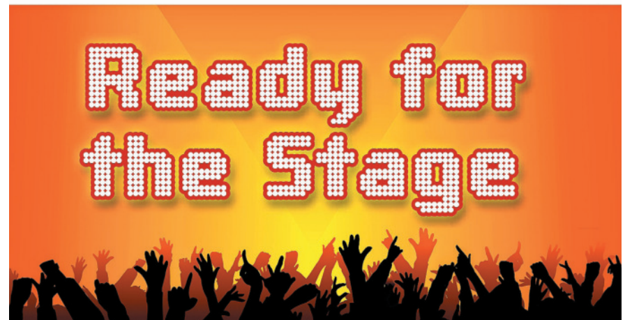
Bandworkshop für Kinder und Jugendliche.