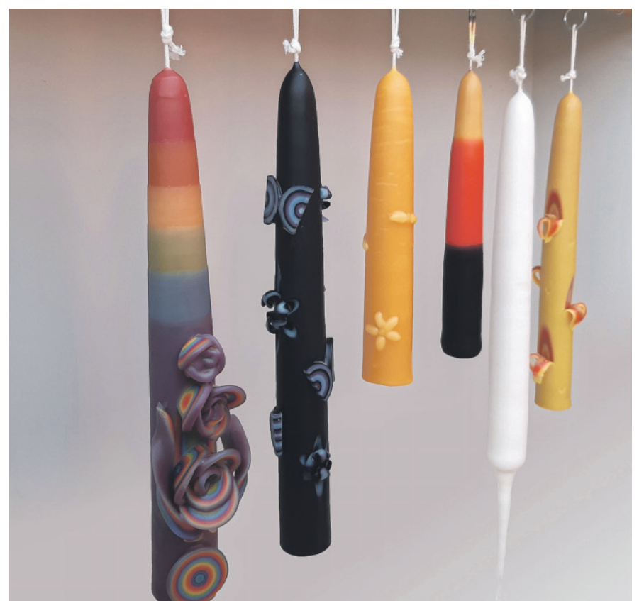
Das Kerzenziehen findet von 19. November bis 7. Dezember am Schluefweg statt.

Weitere Informationen und die Möglichkeit, Tickets zu kaufen, sind ab 3. November auf der Website vfk-kloten.ch zu finden.