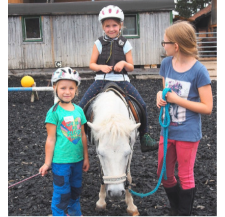
Erlebnistag auf dem Bauernhof.