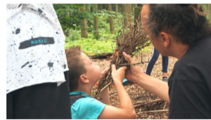
Survival im Wald.

Kontakt und Anmeldung: www.vfk-kloten.ch