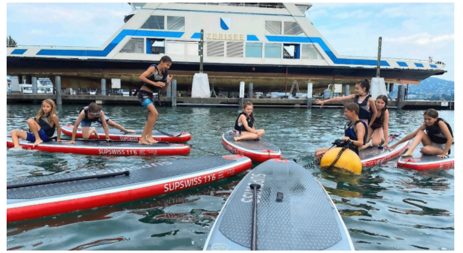
Spass auf dem Wasser.

Aktuell plant die VFK zwei Open-Air-Kinoabende im Freibad, die je nach gülti-