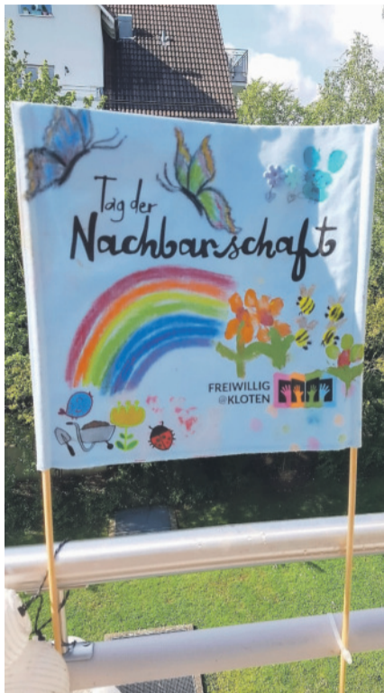
Tag der Nachbarschaft. BILD FREIWILLIG@KLOTEN

Sie können Ihren Nachbarinnen und Nachbarn aber auch eine kleine Überraschung mit persönlicher Botschaft vor die Tür stellen. Kommen Sie am Freitagvormittag, 28. Mai, auf den Stadtplatz und lassen Sie sich vom Verein freiwillig@kloten inspirieren. Erwerben Sie am Stand eine Kleinigkeit für Ihre Nachbarinnen und Nachbarn oder eine Stoff-Fahne. Auch Vizepräsident und Stadtrat Kurt Hottinger wird anwesend sein. Der Verein freiwillig@kloten freut sich auf Ihren Besuch!