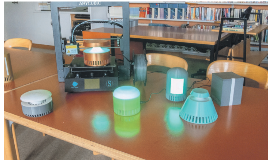
Schön und nützlich: Solange die CO 2 -Geräte grün leuchten, ist die Luftqualität gut.

Sie sind bunt, rund, eckig, zylinder- und kegelförmig. Eine 3. Sekundarklasse hat mit Unterstützung ihres Klassenlehrers, Robert Schatt, insgesamt sieben CO 2 -Geräte mit einem CAD-Programm designt, anschliessend mit einer Slicer Software programmiert und mit dem 3-D-Drucker ausgedruckt. Die Geräte sind mit einem Mikrochip, einem Sensor und