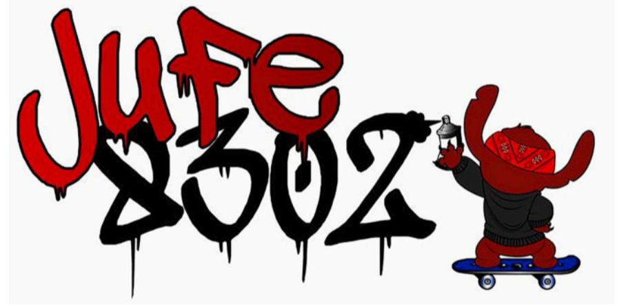
Die Vorfreude auf das Jugendfestival ist sehr gross.

Es gibt also Grund zur Vorfreude auf ein richtiges Highlight im August, vor allem für die Jugend von Kloten aber auch für die Erwachsenen. Die Konzerte finden ausschliesslich für Jugendliche im Stadtsaal statt. Der Aussenbereich ist, sofern es die Corona-Bedingungen zulassen, für die Öffentlichkeit zugänglich. Nicht nur