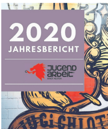
BILD JUGENDARBEIT STADT KLOTEN

Weitere Informationen: www.kloten.ch/jahresbericht