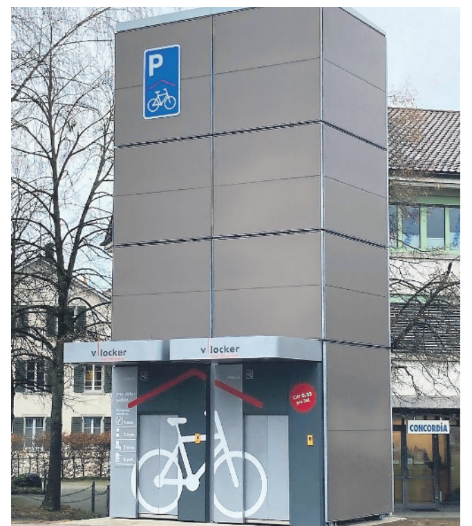
Der neue V-Locker-Turm am Bahnhof Kloten.