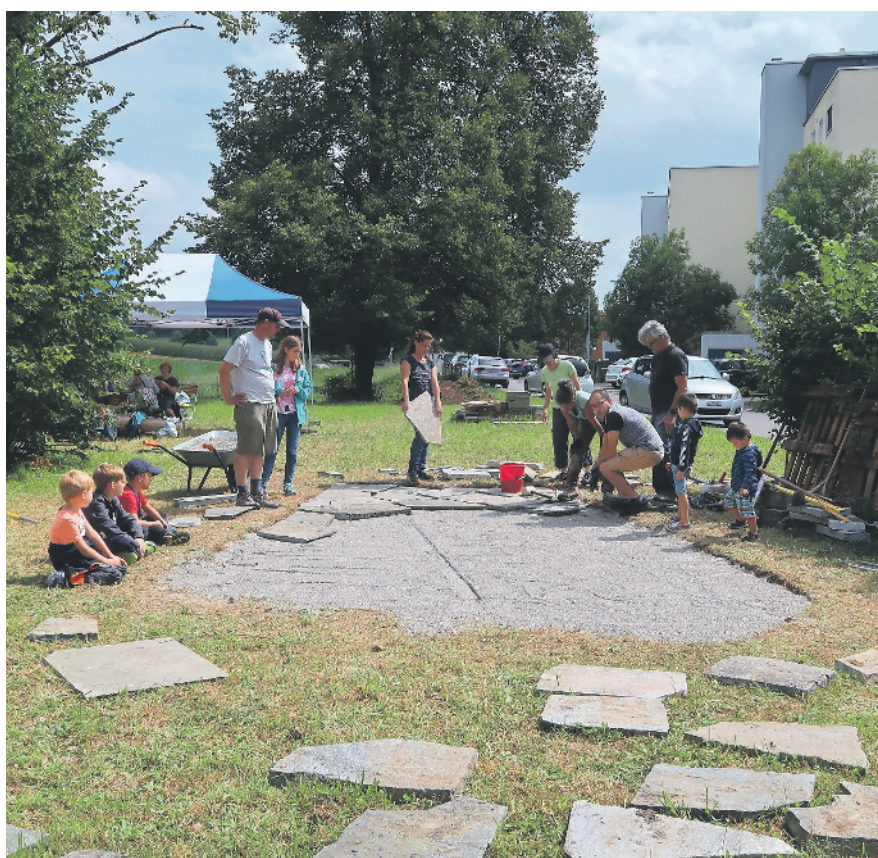
Beim Bau des Natursteinplatzes haben Alt und Jung mitangepackt.

Vereinigung Freizeit Kloten, Schluweg 10, 8302 Kloten, Tel. 044 804 85 55. Detaillierte Informationen zu allen Angeboten finden Sie unter: www.vfk-kloten.ch , www.ludothek-kloten.ch oder auf der Facebook-Seite: VFKloten