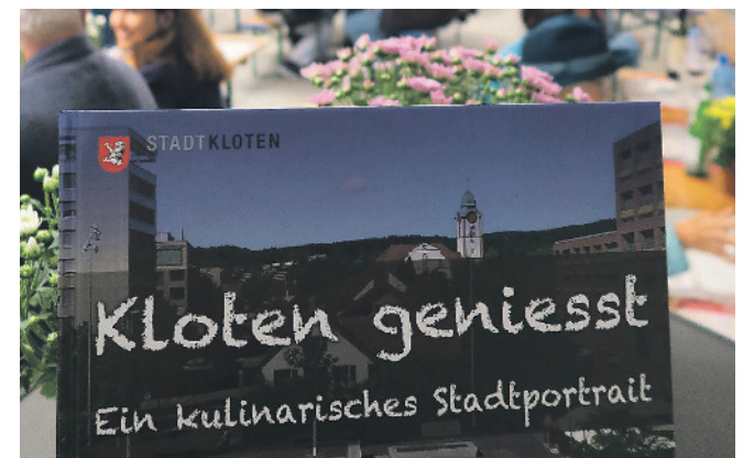
Die Klotener Street Food Tavolata ist jedes Jahr ein kulinarisches Highlight.

Informationen: www.alertswiss.ch und www.sirenentest.ch