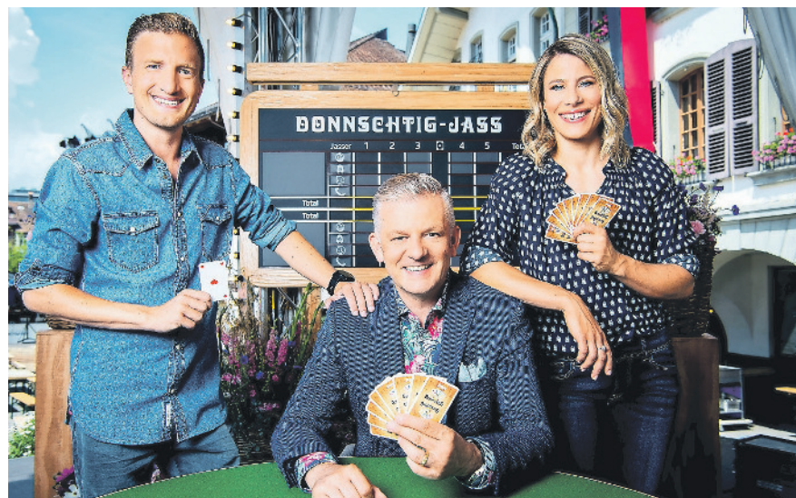
Am 11. August findet der diesjährige «Donnschtig-Jass» in Kloten oder Bassersdorf statt.

Alle Klotener Jasserinnen und Jasser, welche ihre Jasskenntnisse im Differenzler-Jass auffrischen oder unter fachkundiger Anleitung des Jassclubs Kilchberg vertiefen möchten, können dies an den Jassabenden vom Mittwoch, 9. und 23. März, jeweils von 19 bis 22 Uhr tun. Die Anmeldung ist bis zum 4. März möglich. Die Abende finden gemeinsam mit der Ludothek Kloten statt, die 2022 ihr 40-Jahresjubiläum feiert. Selbstverständlich darf