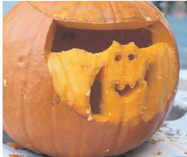
Egal ob beim Kürbisschnitzen oder beim Eierfärben, bei den Aktionen der VFK wird stets fleissig gewerkelt.

Das 40-Jahr-Jubiläum der Ludothek der VFK soll in diesem Jahr mit unterschiedlichen Aktionen gebührend gefeiert werden. Die erste Aktion findet bereits im März im Rahmen des «Donnschtig-Jass» statt. Am 9. und 23. März kann von 19 bis 22 Uhr gemeinsam mit professioneller Unterstützung im Stadthaus gejast werden. Neben der Ausleihe von Spielen, Fahrzeugen, Spielkisten und vielem mehr organisiert die Ludothek im Juli den