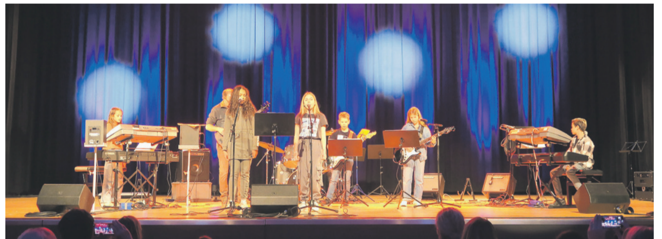
Am Musikschultag ab 13 Uhr stellen einige Bands aus den Bandworkshops der Musikschule ihr Können auf der Bühne unter Beweis.

Was: Musikschultag Wann: Samstag, 13. Mai 10 bis 13 Uhr Instrumentenparcours, ab 13 Uhr Konzert Wo: Musikwerk Kloten, Grubenstrasse 9, 8302 Kloten