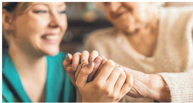
Betreuende Angehörige spielen eine wichtige Rolle im Alltag älterer werdender Menschen.

Weitere Informationen und Link zur Umfrage: www.dein-steinacker.ch