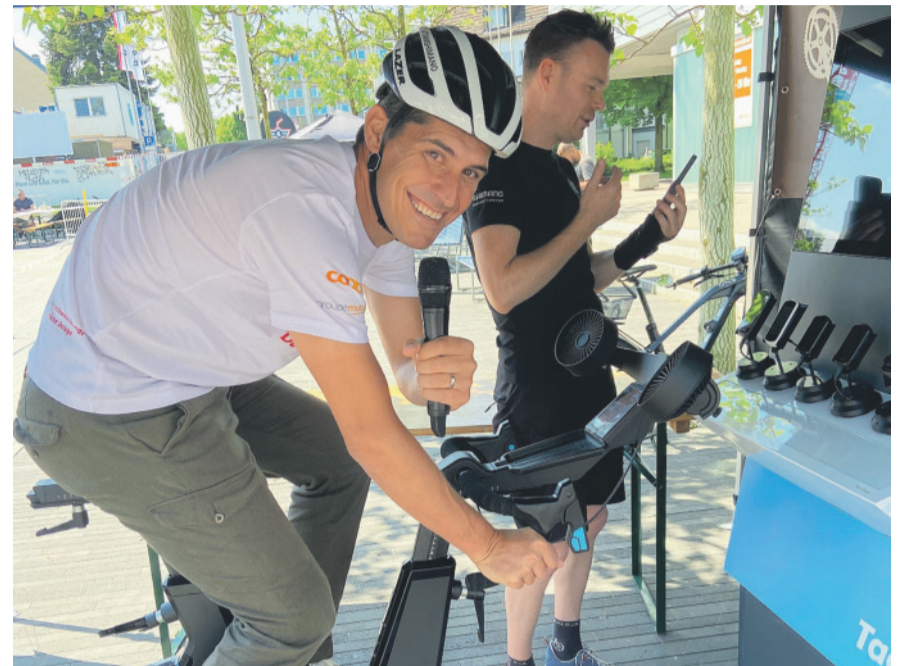
Auch dieses Jahr steht am Klotener Velotag der Fahrradergometer bereit, bei welchem sich Erwachsene und Jugendliche mit anderen ihrer Kategorie über 300 m messen können.

Programm und Informationen: www.schluefweg.ch/velotag