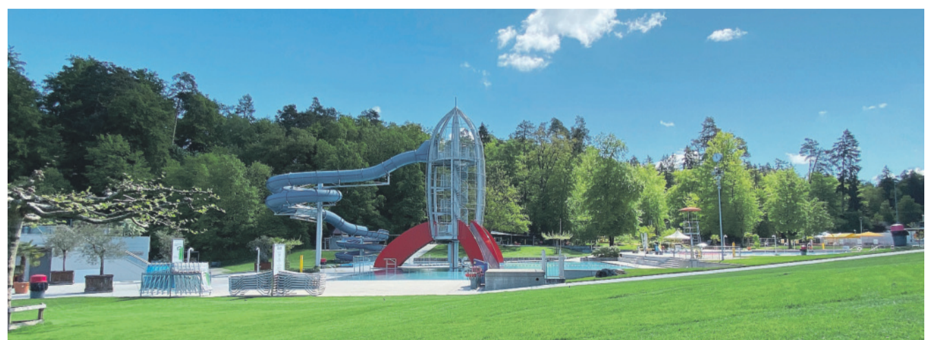
Die Freibad-Saison am Schluweg startet am 13. Mai 2023.

Im Freibad am Schluweg stehen ausserdem zum Preis von CHF 120.00 (exkl. CHF 50.00 Depot) Saisonkabinen zur Verfügung, damit Gäste oder Familien ganz