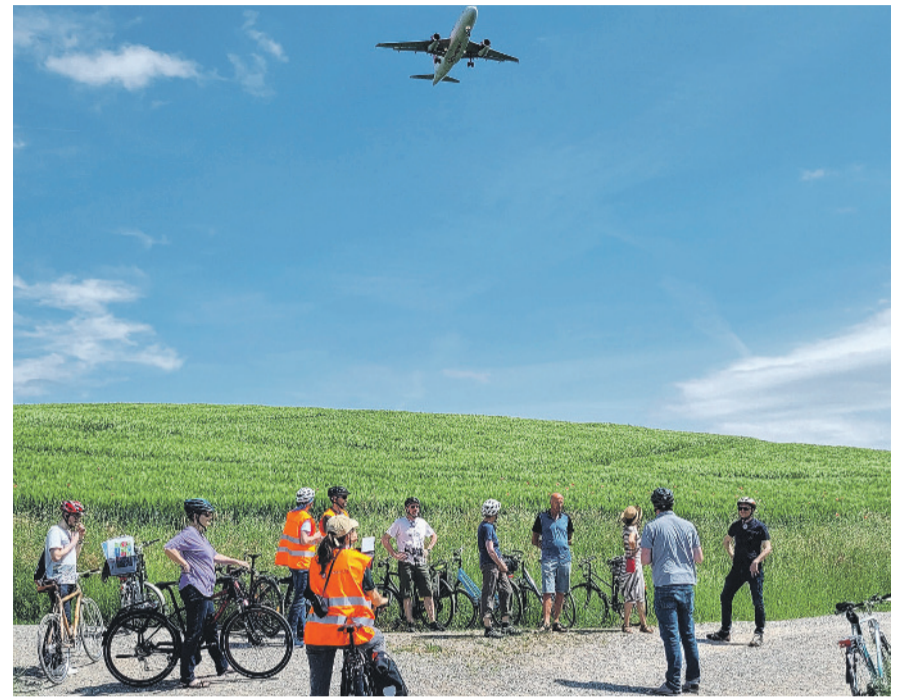
Die Teilnehmenden erhielten vertiefte Einblicke in die Planung der Stadtentwicklung.

Was halten Sie von den aufgezeigten Veränderungen in Themen wie Arbeiten, Wohnen, Erholung, Biodiversität, Klima