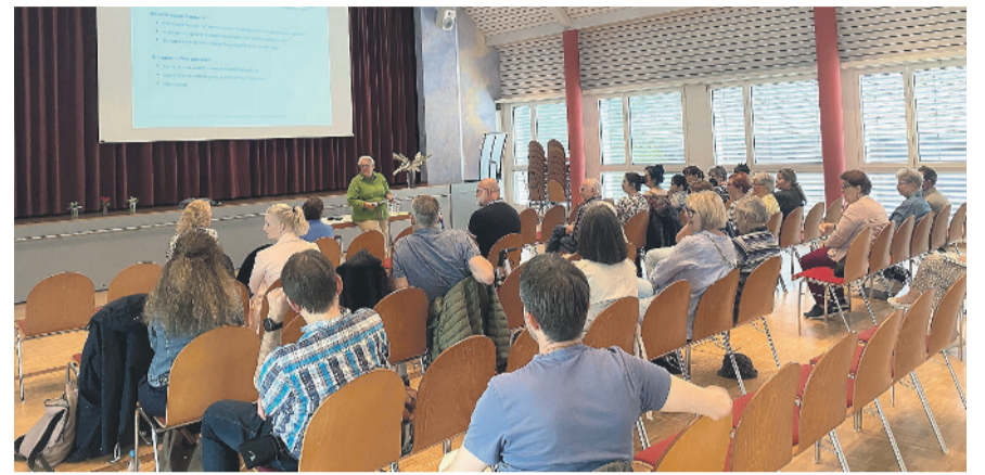
Die Teilnehmerinnen und Teilnehmer tauschten sich angeregt über das Gehörte aus.

Bei Fragen steht Ihnen die Kesb Kreis Bülach Süd unter kesb@kesb-kbs.ch oder Tel. 044 829 68 00 gerne zur Verfügung.