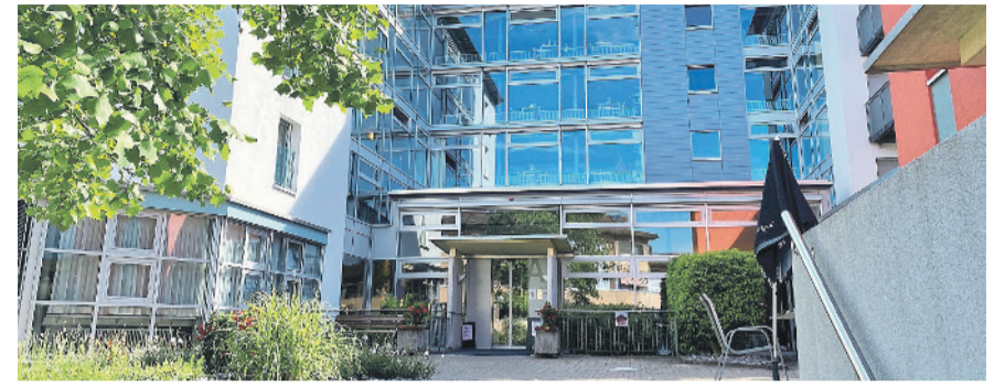
Grosse Jubiläumsparty am Samstag, 11. Juni, im Pflegezentrum im Spitz.

Weitere Informationen: www.kloten.ch/publikationen/382826