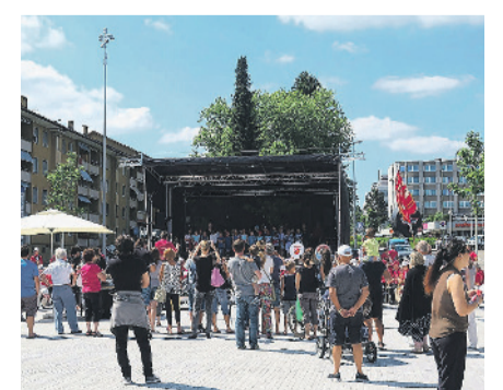
Es ist wieder Programm in Kloten.

Die verschiedenen Daten und Spielzeiten der Künstlerinnen und Künstler finden Sie unter: www.kloten.ch/veranstaltungen/5100323 . Alle Veranstaltungen sind kostenlos.