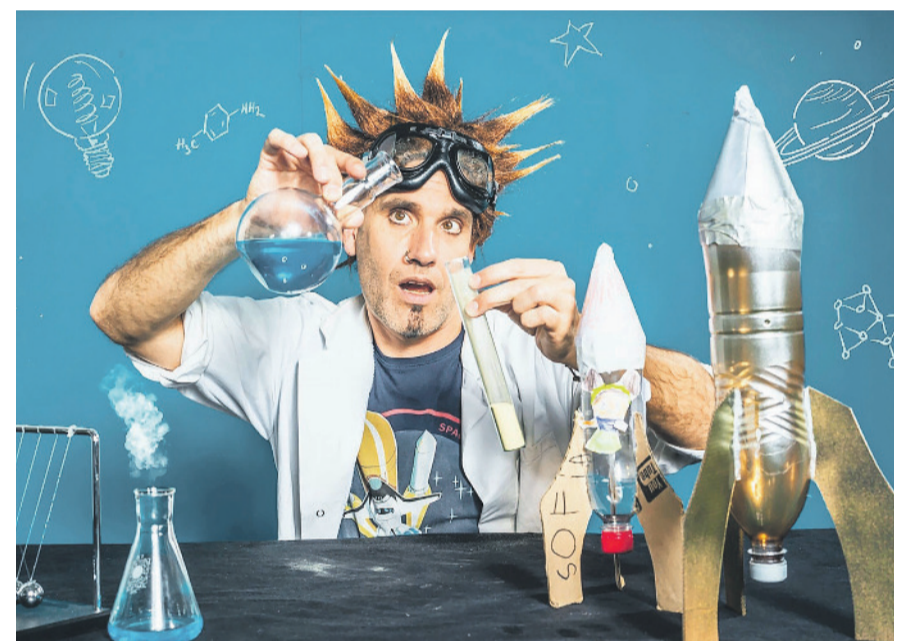
Professor Bumbastic macht diesen Sommer einen Abstecher nach Kloten.

Weitere Informationen: www.vfk-kloten.ch