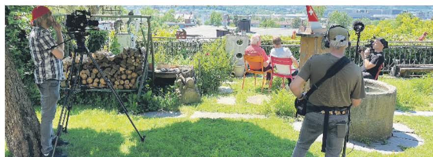
Das Team vom Schweizer Radio und Fernsehen (SRF) fängt für das Ortsporträt für den «Donnschtig-Jass» die schönsten Seiten von Kloten ein.

Weitere Informationen: www.kloten.ch/donnschtig-jass