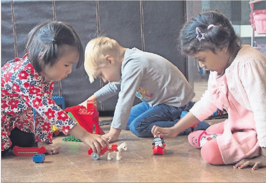
Teil der Spielgruppe der Vereinigung Freizeit Kloten (VFK) ist auch ein integriertes Sprachförderkonzept.