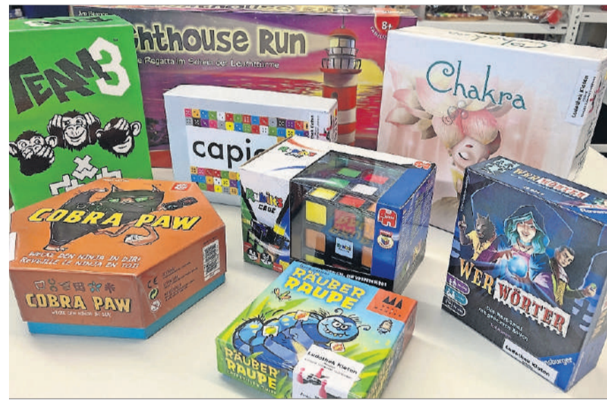
In der Ludothek stehen fast 2500 Artikel zur Ausleihe.

So steht einem unbeschwernten Spielnachmittag in der Familie oder einem Spielabend mit Freunden nichts im Weg. Die Ludothek verfügt