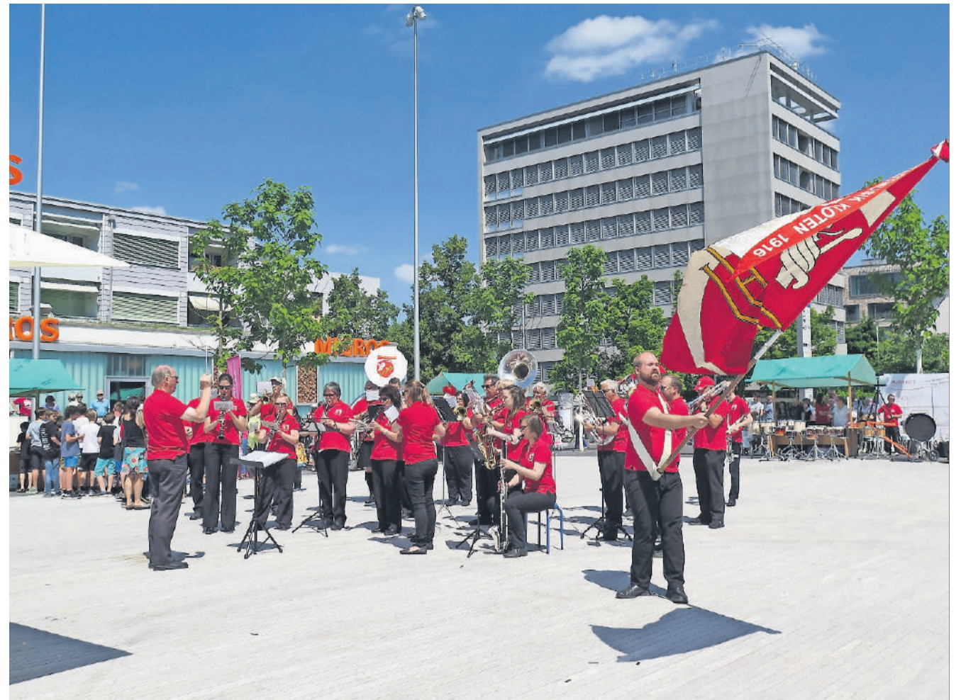
Spiele am 4. September auf dem Stadtplatz: Die Stadtmusik Kloten.

Die 3. Klotener Street Food Tavolata findet am 28. und 29. August statt. Neun Klotener Gastronomen laden zum gemütlichen Sommerabend mit leckerem Essen und vielen verschiedenen kleinen Gerichten ein. Sitzplätze gibt es im Zelt, bei schönem Wetter auch draussen. Von Antipasti über Sushi, Fleischspezialitäten, Fisch, französische und asiatische Spezialitäten bis hin zu hausgemachten Gelati erwartet die Gäste ein kulinarisches Abenteuer. Kloten geniesst – natürlich auch mit passenden Getränken zu jedem Gericht.