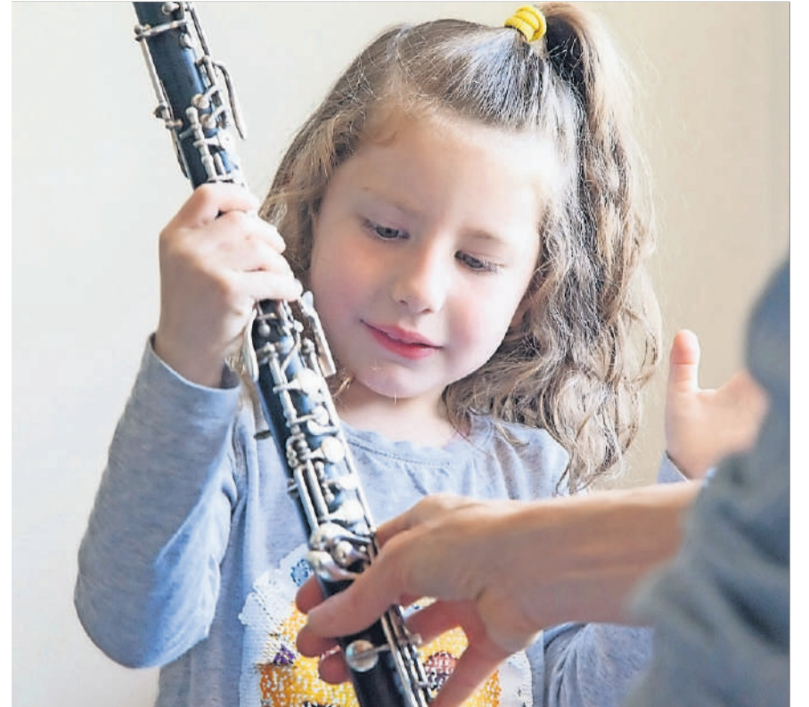
Das Angebot an Instrumenten ist sehr umfangreich ...

Samstag, 11. Mai, 10 bis 14 Uhr, Musikwerk Kloten, Grubenstr. 9, Kloten