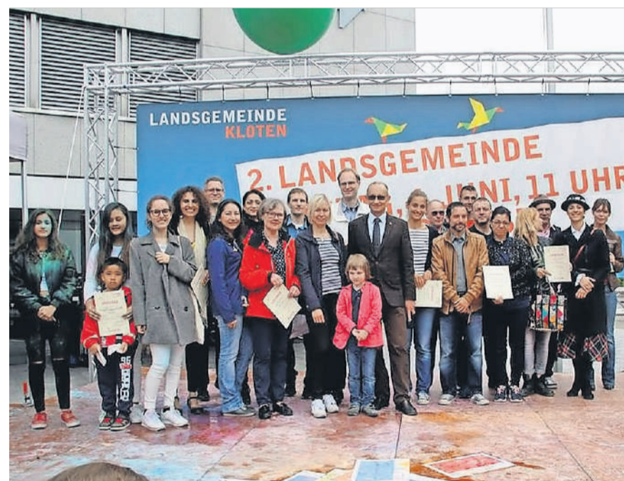
Die Votingphase für die Landsgemeinde endet am 31. Mai.

An die Landsgemeinde selbst, am Samstag, 15. Juni, werden schlussendlich acht Projektinitianten eingeladen; ihre Projektideen hatten am meisten Stimmen erhalten. Aber wie geht das? Alle, denen Kloten am Herzen liegt, dürfen abstimmen, indem sie die Projekte bewerten und ihnen eine Stimme geben oder auch nicht. Mit nur einem Klick auf der Projek-