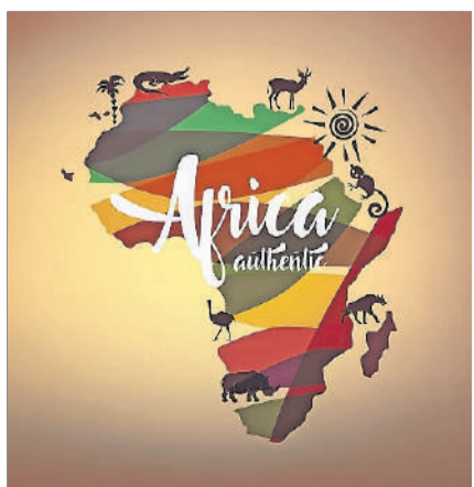
Im Zentrum des Abschlusskonzerts des Musiklagers steht Afrika.

Weitere Informationen: www.musikschule-kloten.ch