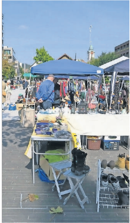
Für die drei Flohmärkte können Plätze reserviert werden.