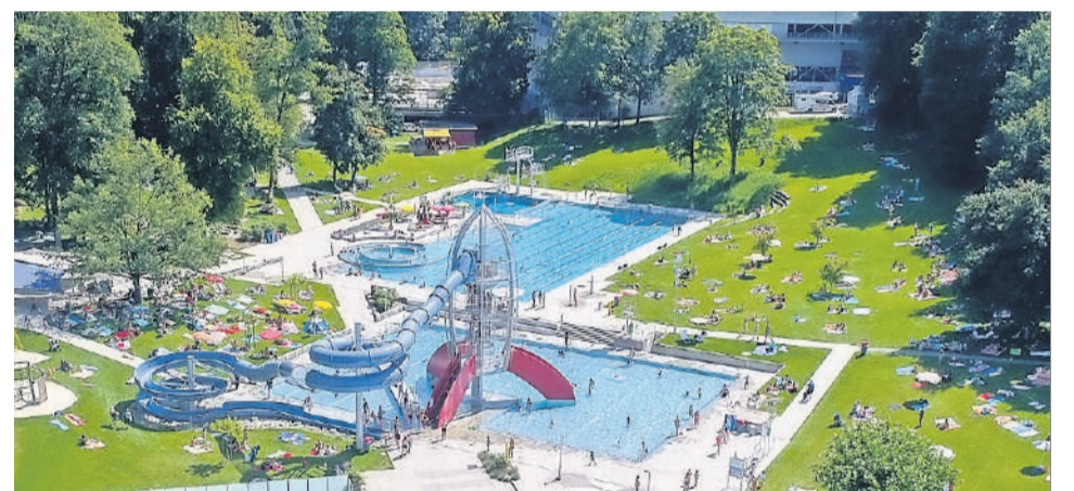
Für Sonnenhungrige bereits offen: Das Freibad Schluefweg.

Weitere Informationen unter: www.schluefweg.ch