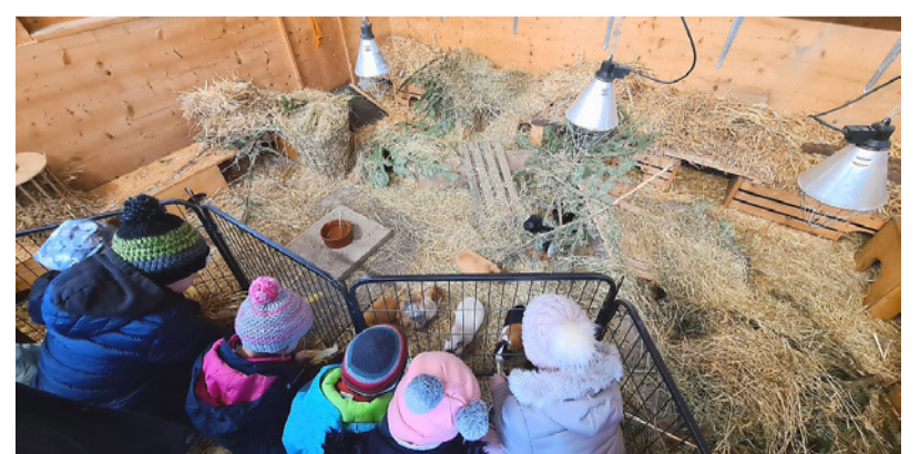
Die Kinder hatten viel Spass bei den Angeboten der VFK während der Sportferien.