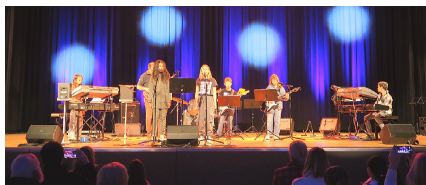
Bandworkshop Musikschule Region Flughafen.

Der Schalter der Abteilung Sicherheit bleibt weiterhin an der Dorfstrasse 58 und unterstützt die Bevölkerung unter anderem bei Anliegen rund um den öffentlichen und privaten Verkehr (ÖV, blaue