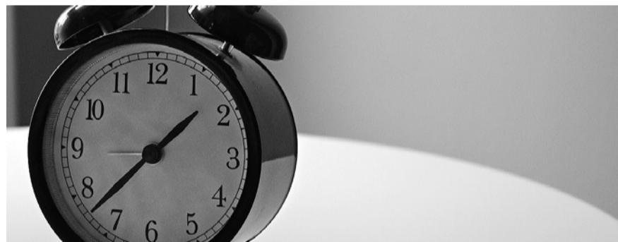
Bald werden die Uhren auf Sommerzeit umgestellt.

man keine «Zeitinsel» in Europa mehr sein wollte. In unseren Nachbarstaaten Frankreich und Deutschland wurde die Sommerzeit zum ersten Mal bereits während des Ersten Weltkriegs eingeführt, um wenige Jahre später wieder abgeschafft und dann erneut eingeführt zu werden. Der Grundgedanke hinter der Sommerzeit ist, dass durch das längere Tageslicht Energie eingespart werden kann. In der Schweiz gibt es allerdings seit Jahren Bestrebungen, die Sommerzeit wieder abzuschaffen.