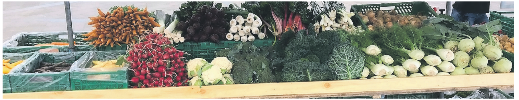
Eine grosse Auswahl an frischen Früchten und Gemüsen.

Bei neuen Reihen- und Familiengräbern auf dem Friedhof Chloos wird auf eine mehrjährige blühende Bepflanzung gesetzt. Diese Form der Bewirtschaftung ist ökologisch wertvoller als die bis anhin angewendete Wechselbepflanzung. Die Angehörigen können auf dem Friedhof die Staudenbepflanzung zuerst begutachten und bei der Pflanzenwahl für das Grab der Verstorbenen auch selbst Wünsche und Ideen einbringen. Das Friedhofsgärtnerenteam unterstützt die Angehörigen dabei gerne.