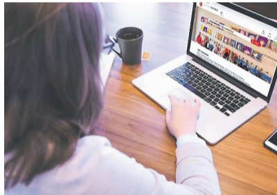
Neues Design.

Weitere Informationen: www.freiwillig-kloten.ch