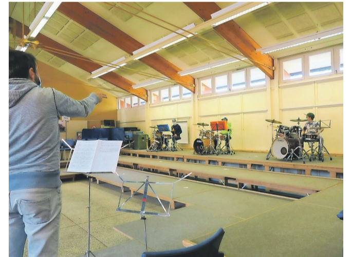
Perkussions-Aufnahmen mit genügend Abstand.