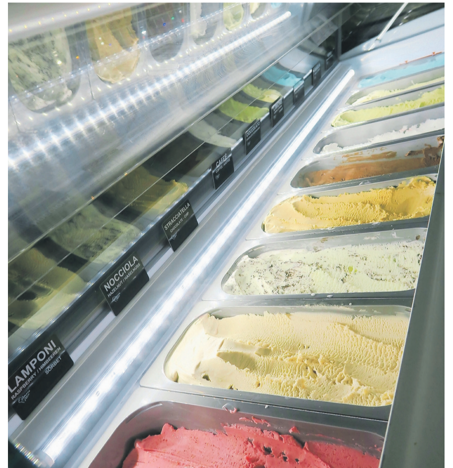
Eine grosse Auswahl an köstlichem Eis.