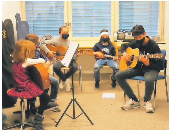
Kleine Formation mit Gitarren und Ukulele.

Die Kinder der Musikschulen freuen sich schon jetzt auf viele Zuhörerinnen und Zuhörer. Sobald das digitale Konzert zusammengestellt ist, kann dieses über den Youtube-Kanal der Stadt Kloten abgerufen werden. Die Musikschule Kloten Bassersdorf Lufingen wird zur gegebenen Zeit wieder informieren.