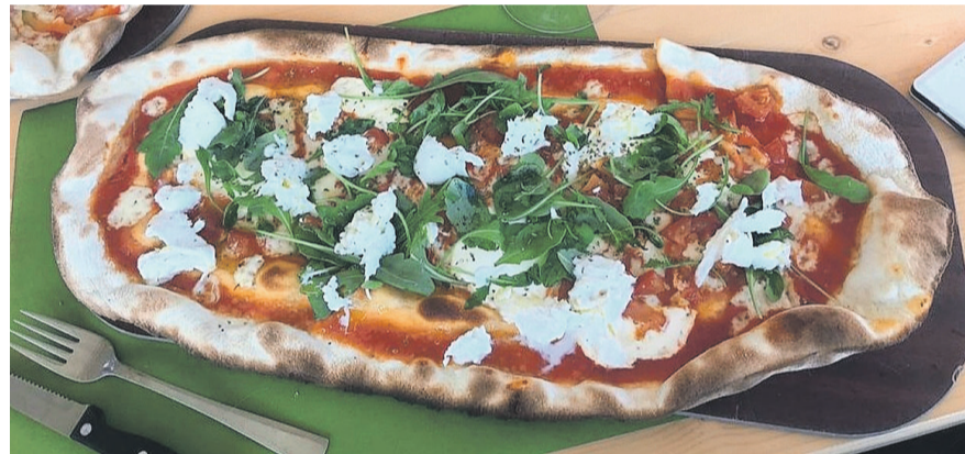
Knusprige hausgemachte Pizza.

Weitere Informationen: stadtplatz@kloten.ch oder 044 815 12 93