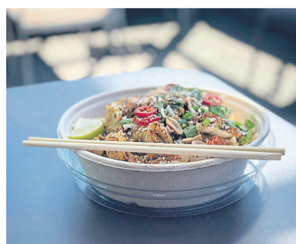
Das gesamte kulinarische Angebot kann online bestellt werden.

boten. Eine Übersicht der Restaurants und Take-aways gibt es hier: www.kloten.ch/gastronomie . Zusätzliche Einträge dürfen gerne bei stadtplatz@kloten.ch