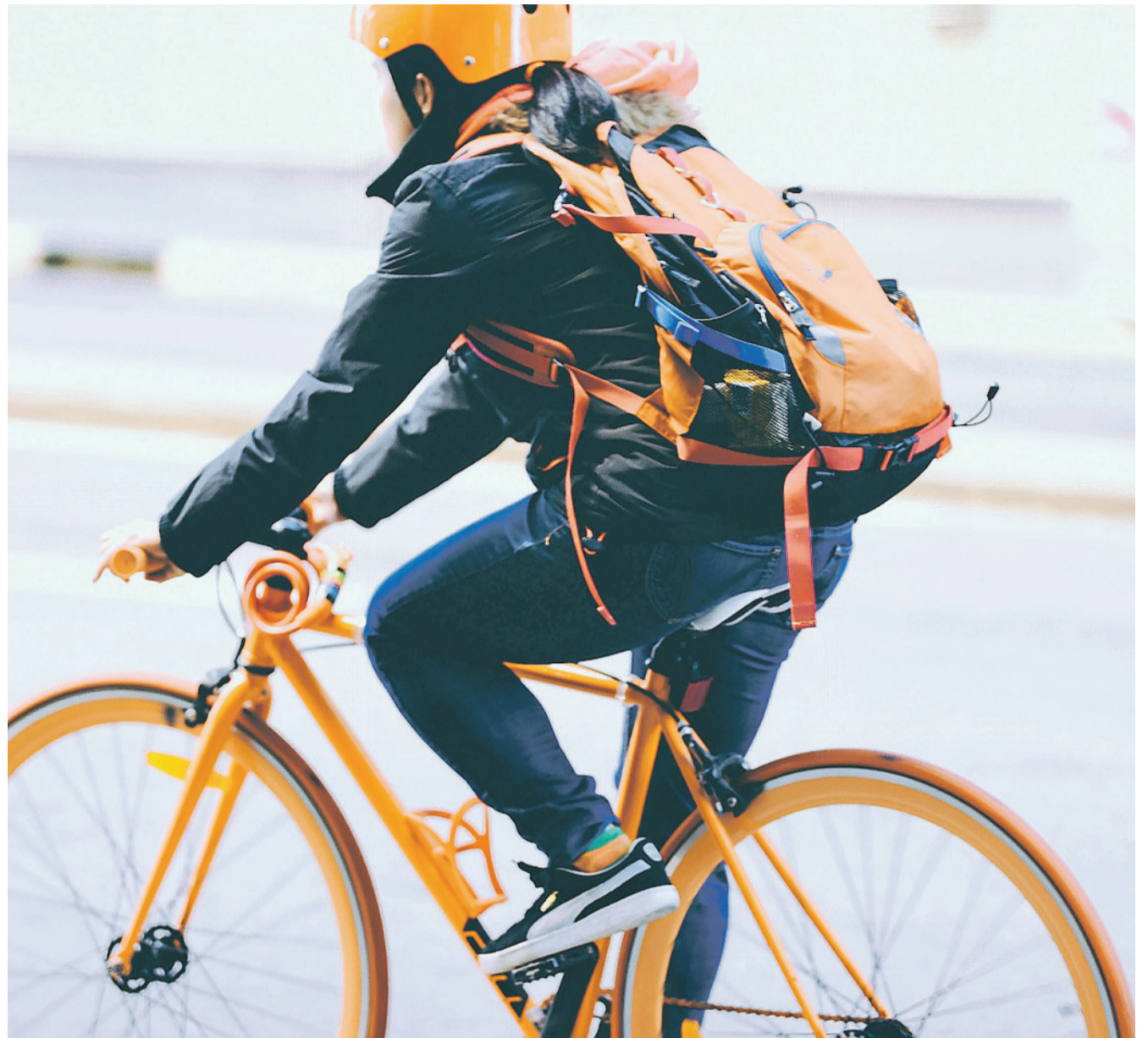
Der Klotener Velotag lockt mit einem vielseitigen Programm rund ums Velo.