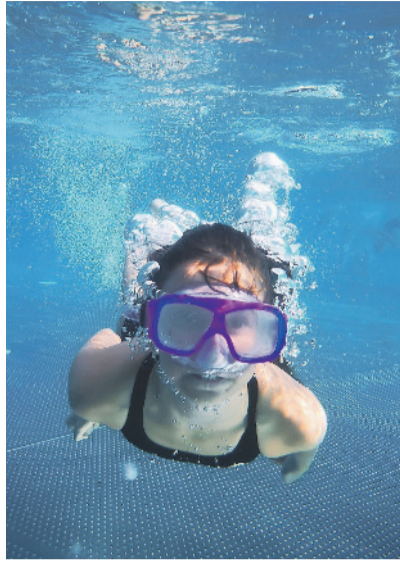
Die neuen Freizeitkurse bieten Klotener Kindern viel Bewegung und Spass.