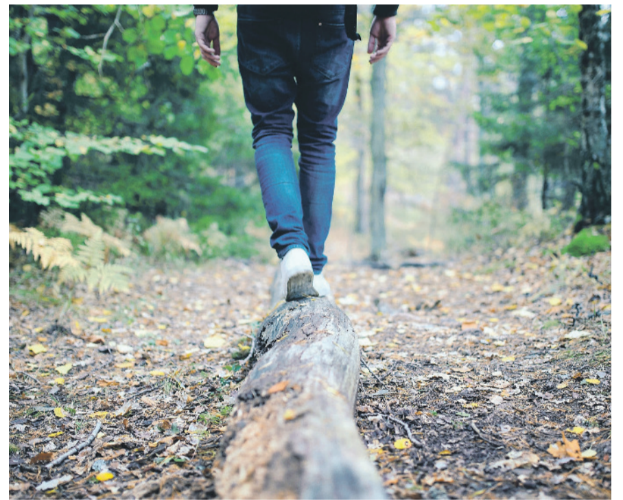
Schon einfache Balanceübungen und genügend Bewegung können helfen, Stürze im Alltag zu vermeiden.

Informationen: www.bfu.ch und www.sichergehen.ch