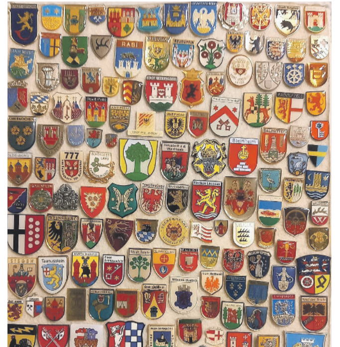
BILDER GRZEGORZ WITKOWSKI