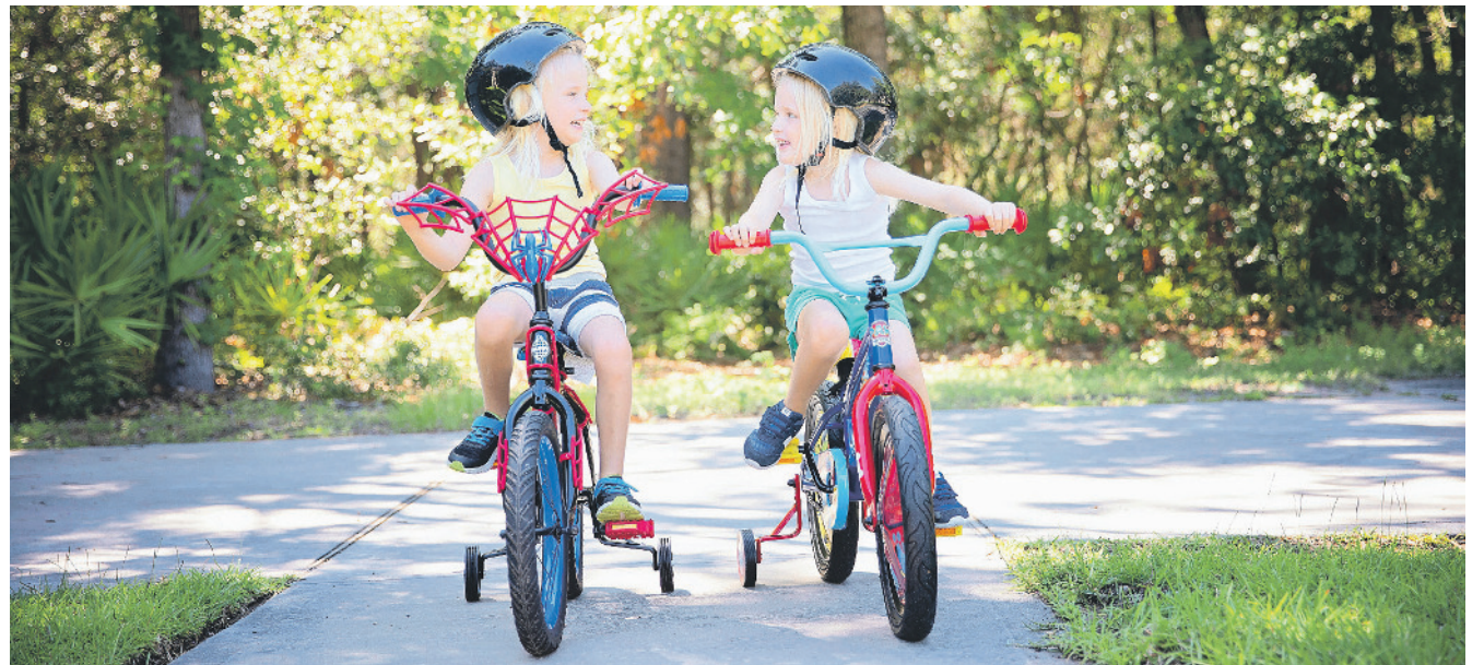
Mit ein paar wichtigen Tipps lassen sich viele Unfälle in der Kindheit vermeiden.

Schon kleine Tümpel mit nur einigen wenigen Zentimetern Wassertiefe können für Kinder zur tödlichen Gefahr werden. Halten Sie Ihr Kind daher in der Nähe