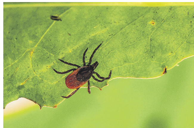
Zecken lassen sich von Gräsern und Pflanzen auf vorbeistreifende Menschen und Hunde fallen.

Sollten Sie trotz aller Vorsicht doch mal eine Zecke an sich entdecken, entfernen Sie die Zecke möglichst rasch, indem Sie