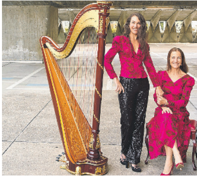
Das Mutter-Tochter-Gespann begeistert das Publikum mit einer Kombination aus Klavier und Harfe.