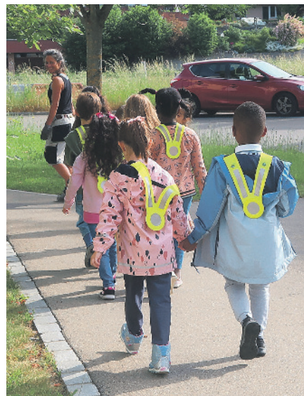
BILDER PETRA HAGEN HODGSON