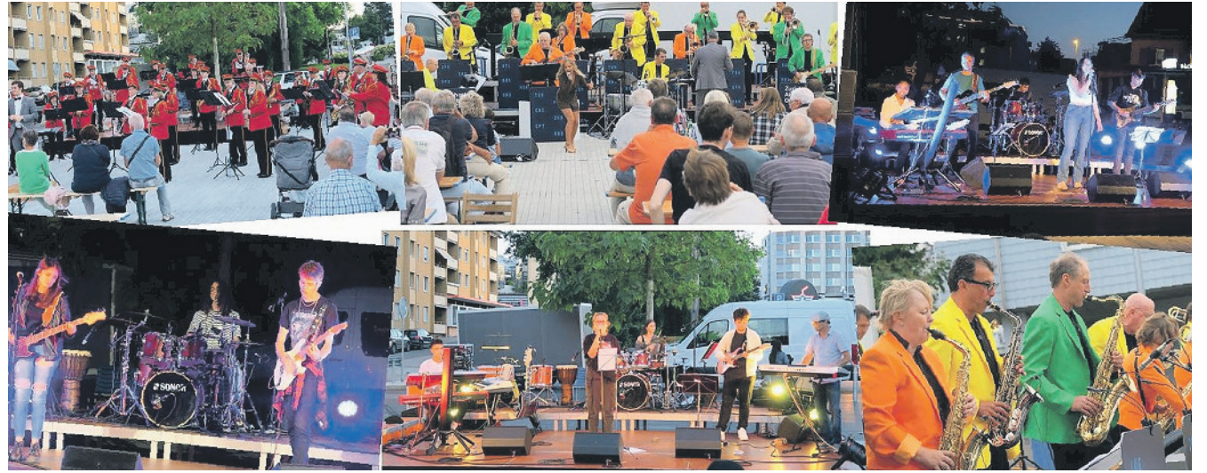
Die Open-Air-Konzertreihe auf dem Stadtplatz hat für jeden Geschmack etwas zu bieten.