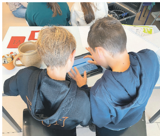
Dank einer Online-Umfrage weiss die Lehrerin schnell, was die Kinder alles über die Römer wissen möchten.

«Die Vorteile überwiegen klar», ist die junge Lehrerin überzeugt. Die Klasse nutzt Laptops für Online-Übungen in Französisch, um das Einmaleins oder unregelmässige Verben zu büffeln. Die Kids recherchieren selbstständig für Projekte im Internet, und im Deutsch kann die Lehrperson zum Beispiel individuelle Online-Übungen zuteilen, je nach Schwierig-