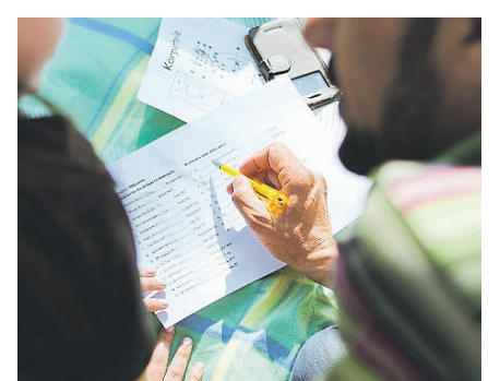
Deutschkurse in Kloten.

Es stehen sieben Kurse zur Auswahl, die entweder vormittags, am Abend oder am Samstag stattfinden. Die Kurskosten betragen 300 Franken inklusive Lehrmaterial. Die Kurse umfassen die Niveaus von A1 (Anfänger ohne Vorkenntnisse) bis einschliesslich B1 und finden im Schulhaus Dorf Feld und Zentrum Schluweg statt. Kursziel ist die Verbesserung der Sprache und der Grammatik. Zudem kann das Selbstvertrauen aufgebaut werden, um mehr Freiheit im Alltag und bei der Arbeit zu haben.