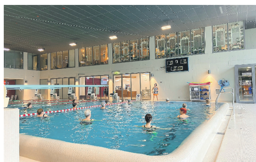
Auch 2022 wieder Aquafit im Hallenbad Schluefweg.

Die Bushaltestellen Freienberg und Chanzler werden zu hindernisfreien Halte-