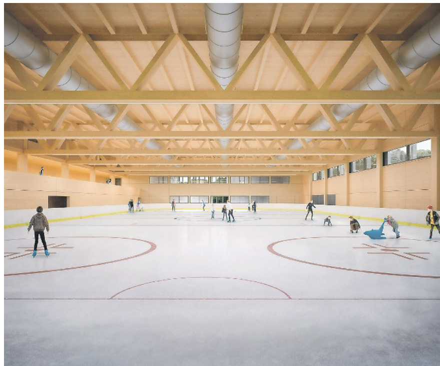
Visualisierung: Innenansicht des überdachten 2. Eisfeldes zeigt das Holztragwerk.

Weitere Informationen: www.amtsblatt.zh.ch