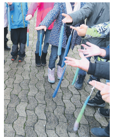
Auf dem Stadtplatz findet wieder das Kerzenziehen statt.