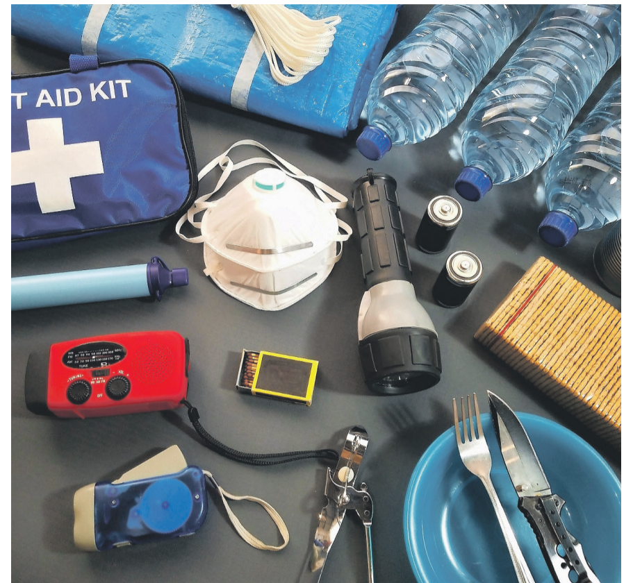
Es wird empfohlen, immer einen Notvorrat zu Hause zu haben.

Weitere Informationen: Eberhard Gartenbau AG, Telefon 044 804 10 70, Fax 044 804 10 71 www.eberhard-gartenbau.ch