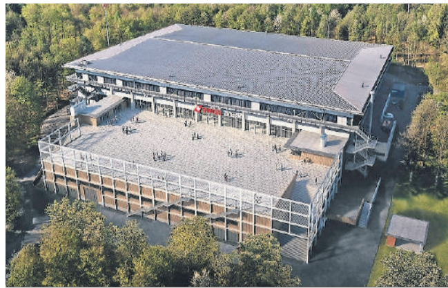
Visualisierung der Swiss-Arena mit dem Ersatzneubau.

Der schlechte Zustand der Tragwerke des Gebäudes sowie auch der Infrastruktur würde eine Schliessung der Anlage in zirka 3 Jahren zur Folge haben. Wenn die Stimmberechtigten von Kloten dem Kredit von 30 375 000 Franken (inkl. MwSt.) für den Ersatzneubau zustimmen, werden neben dem Komplettersatz und der Einhausung des 2. Eisfeldes die Einrichtungen der Eishalle an die