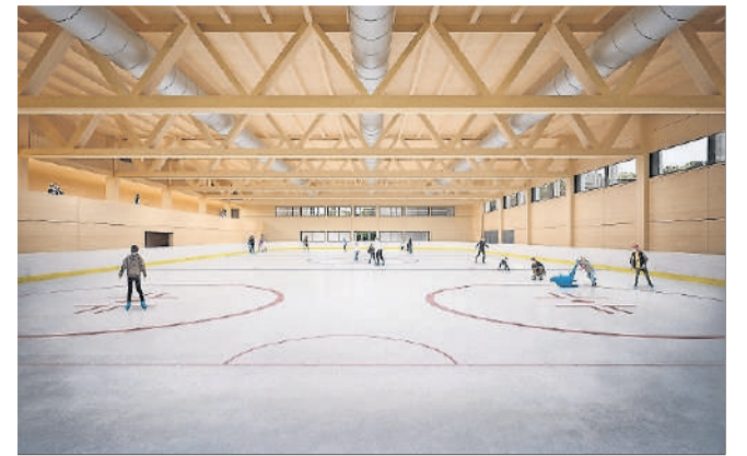
Visualisierung des überdachten Eisfeldes.