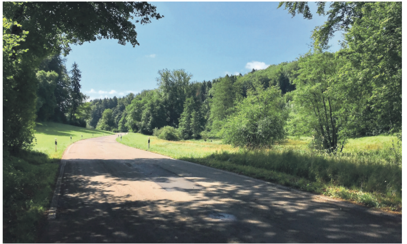
Amphibien wie auch Brutvögel profitieren von der Sperrung der Eigtalstrasse.

Online reservieren: www.winmedio.net/kloten Täglich weitere Tipps: www.facebook.com/Stadtbibliothek.Kloten