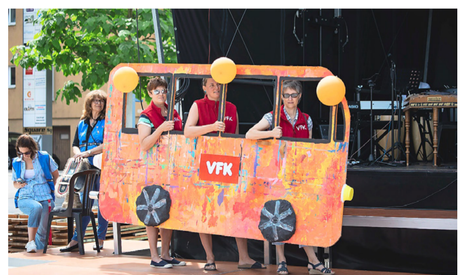
Jede und jeder kann an der Klotener Landsgemeinde seine Ideen eingeben.

Informationen: www.landsgemeinde-kloten.ch