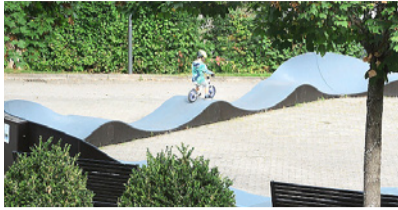
Der Pumptrack bietet viel Spiel und Spass.