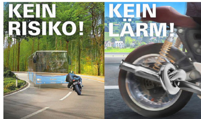
Sicher und ohne Lärm unterwegs.

angemessene Geschwindigkeit, Blickkontakt mit anderen Verkehrsteilnehmenden, Bremsbereitschaft und Rücksicht können das Unfallrisiko zusätzlich senken. Zusätzlich schützt die passende Mo-