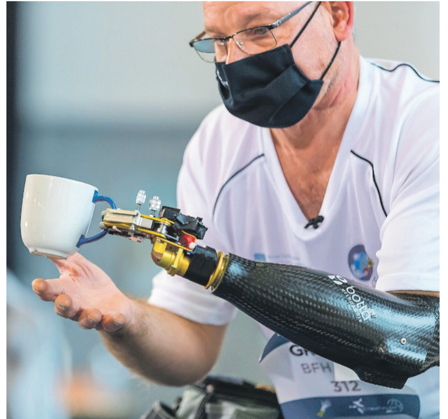
Bei den Cyathlon-Wettkämpfen treten die Teams in acht Disziplinen gegeneinander an.

Der Cyathlon ist ein Non-Profit-Projekt der ETH Zürich, das Entwicklerinnen und Entwickler auf der ganzen Welt heraus-