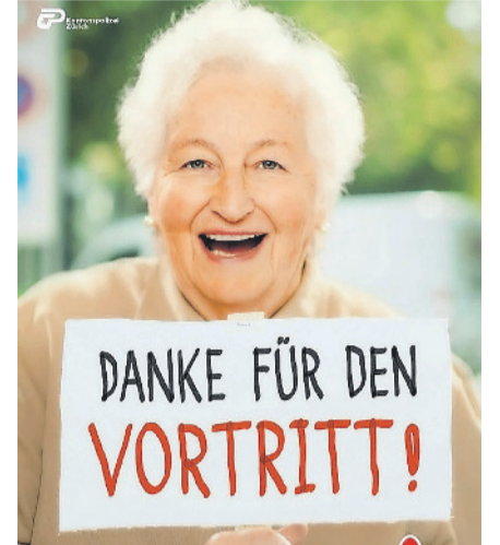
TEXT UND BILDER KANTONSPOLIZEI ZÜRICH