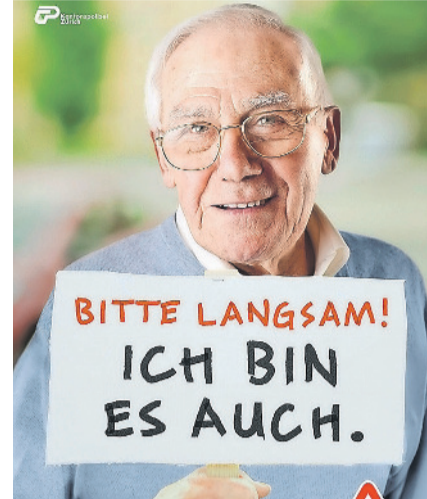
Kampagne für mehr Rücksichtnahme im Verkehr.

Mehr Informationen: www.weniger-senioren-unfaelle.ch