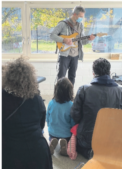
BILDER MUSIKSCHULE (JL)