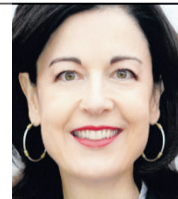
Regine Sauter Nationalrätin FDP