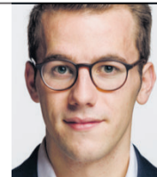
Andri Silberschmidt Nationalrat FDP