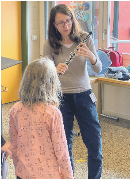
Vielfältiges Programm: Instrumentenpräsentationen und selbstständiges Ausprobieren.