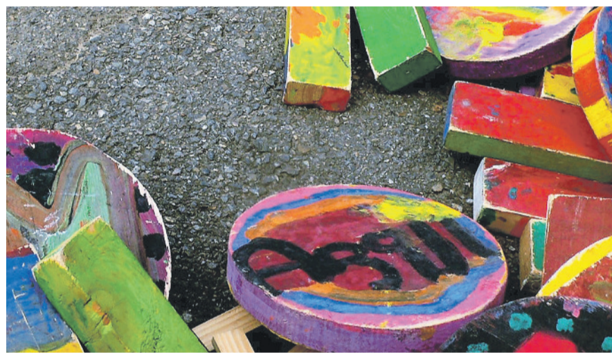
Einladung zum Bauen, Spielen, Malen und Experimentieren.