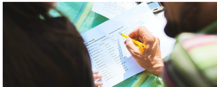
Zur besseren Integration finden wieder Deutschkurse statt.

eine Trommelshow der «Querschleger», die Vergabe des Prix Volontaire 2022 und ein Konzert von «the gardener and the tree» auf dem Programm. Zum Abschluss gibt es eine wärmende Suppe für alle.