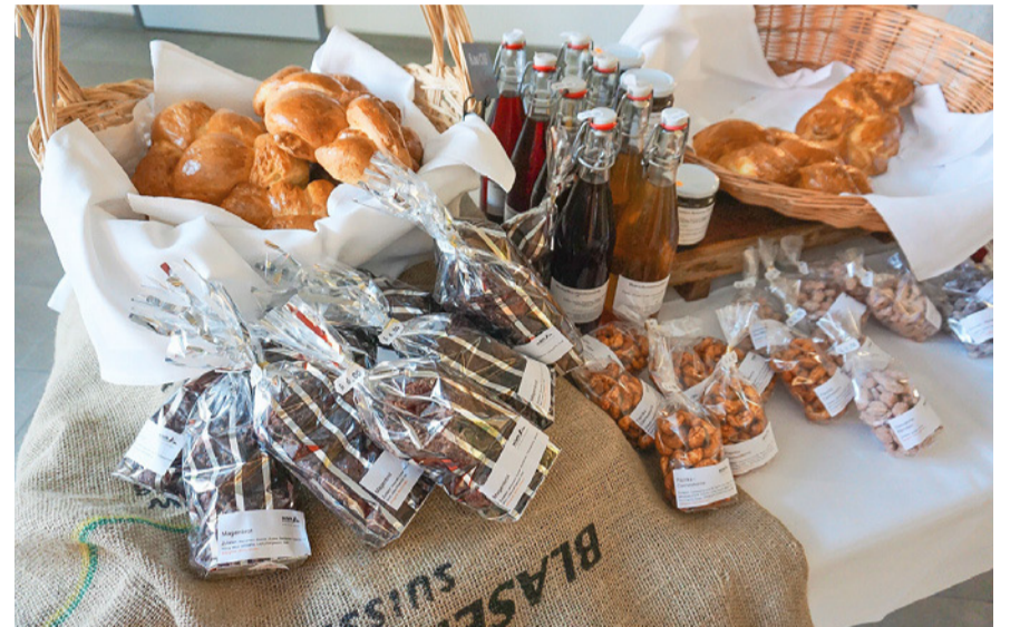
Selbst gemachte saisonale Leckereien zum Mitnehmen.