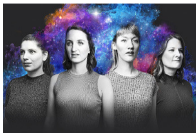
Vielseitigkeit und Qualität: Dezibelles. ZVG