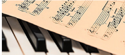
Bunter Mix aus Evergreens.