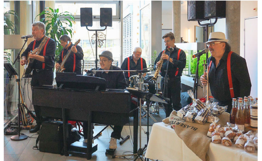
The Matt's Live Band sorgte für die musikalische Umrahmung.

Musikalisch umrahmt wurde das Fest durch The Matt's Live Band und «Viva Varia». Für zusätzliche Unterhaltung sorgten das Glücksrad mit vielen spannenden Preisen, diverse Verkaufsstände mit selbst gemachten Leckereien zum Mitnehmen, Tischfussball und Mr. Balloon, der mit einfachen Ballons Kunstwerke entstehen liess. Die glücklichen Gesichter der Besucherinnen und Besucher waren Beweis für ein gelungenes Fest.