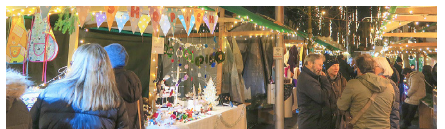
Eine Vielzahl an Ständen mit Köstlichkeiten und Geschenkideen.

Weitere Informationen und Programm: www.klotener-adventsmarkt.ch , per E-Mail an stadtplatz@kloten.ch oder telefonisch unter 044 815 12 93