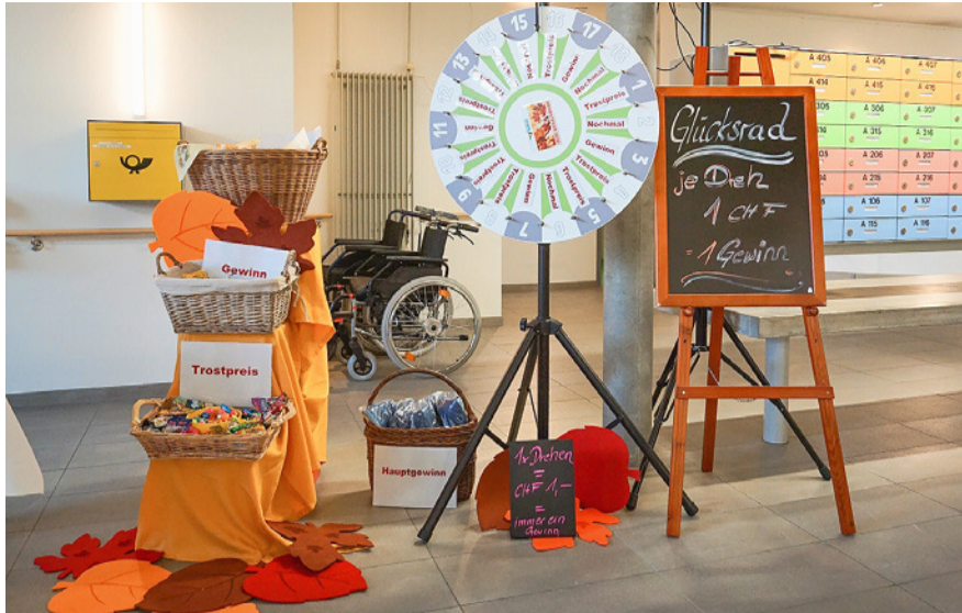
Zufall oder Glück? Jeder Dreh am Glücksrad war ein Gewinn!