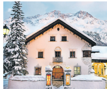
Hinter den historischen Mauern erwartet die Besucher ein zeitgemässes Interieur.

Giardino war schon immer anders als andere Luxushotels in der Schweiz. Die Giardino-Hotels verblüffen mit ihrer ganz eigenen Interpretation von Luxus. Für ein Gefühl wie zu Hause. (pd.)