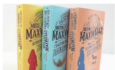
Die Chroniken von St. Mary's.

Online reservieren: www.winmedio.net/kloten Täglich weitere Tipps: www.facebook.com/Stadtbibliothek.Kloten