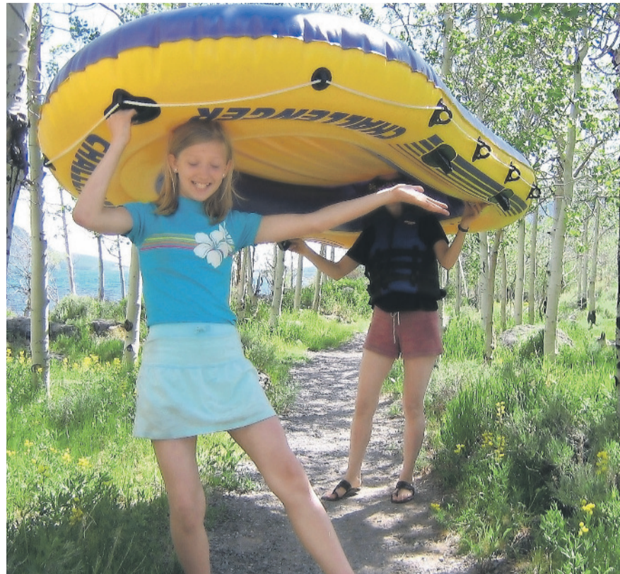
Bereitet Spass, birgt aber auch einige Gefahren: Gummiboote auf dem Fluss.

Unbekannte Flussabschnitte müssen vor der Fahrt zuerst erkundet werden. Schwellen oder Felsen verursachen Wirbel und Strömungen. Hindernisse knapp unter der Wasseroberfläche oder herabhängende Äste, Wehre und Brückenpfeiler stellen zusätzliche Gefahrenstellen dar. Die Wassertiefe und Strömung kann vor allem nach längeren Trockenperioden oder starken Regenfällen variieren.