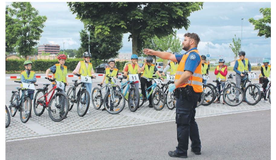
Letzte Instruktionen vom Polizisten für den Geschicklichkeitsparcours.