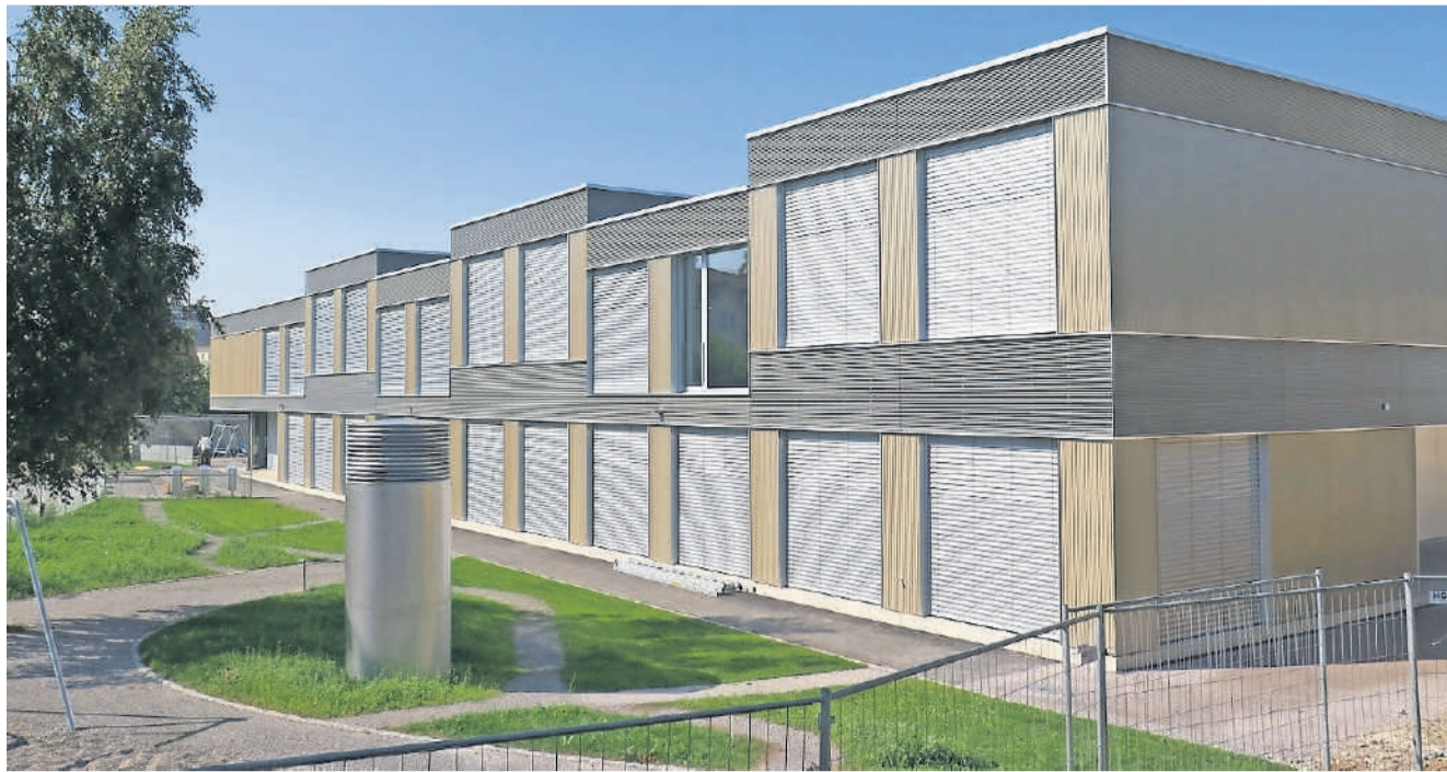
Einblicke versperrt: Am Samstag, 9. September, erhält die Bevölkerung die Gelegenheit, die Erweiterung des Schulhauses Feld zu besichtigen. Anwesend werden auch die zuständigen Stadträte sein.