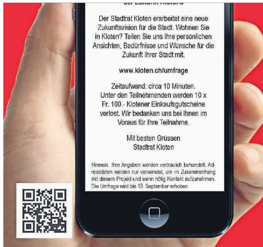
Mit einer Umfrage erarbeitet der Stadtrat eine Zukunftsvision.

Hinweis: Ihre Angaben werden vertraulich behandelt. Adressdaten werden nur verwendet, um im Zusammenhang mit diesem Projekt und wenn nötig Kontakt aufzunehmen. Besonders wenn Sie interessante Inputs dazu haben, nehmen wir Kontakt auf, um mehr darüber zu erfahren. Die Umfrage wird bis 10. September erhoben.