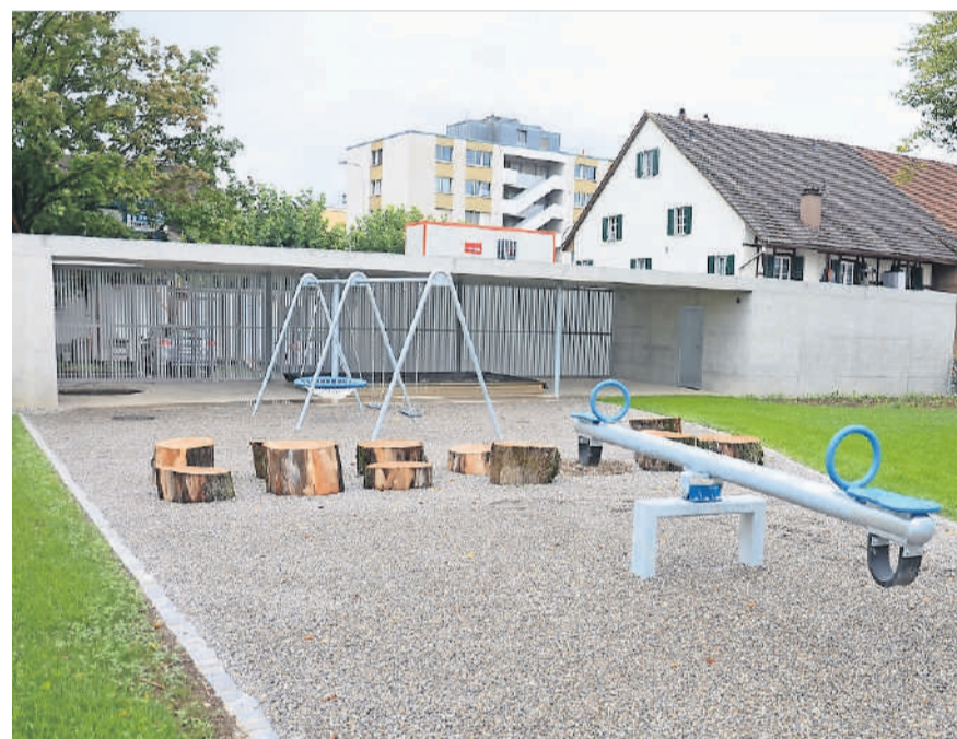
Die neu gestaltete Aussenanlage.

Das bestehende Schulhaus Dorf wird im ersten Halbjahr 2019 sanft und den denkmalpflegerischen Aufla-