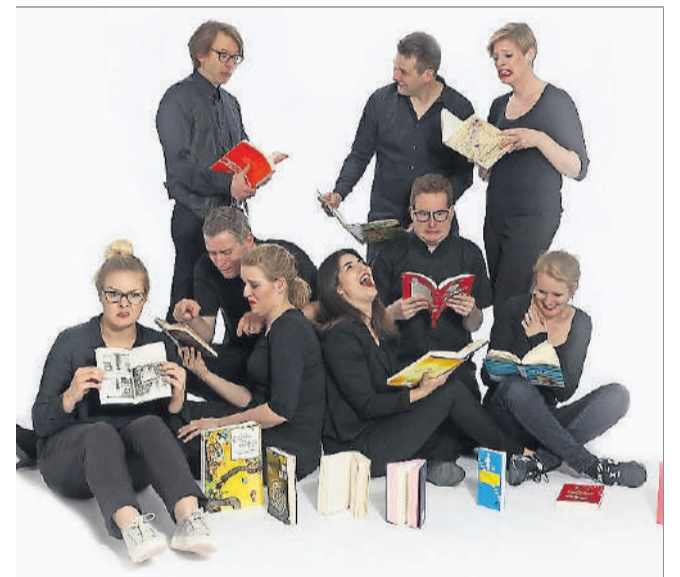
Roseway garantiert einen kurzweiligen Abend.

Denn das Publikum entscheidet, was auf der Bühne passiert: Aus dem reichen Bücherfundus der Stadtbibliothek können Lieblingsbücher, bewährte Klassiker und skurrile Fundstücke ausgewählt werden, welche von den Schauspielern dann szenisch