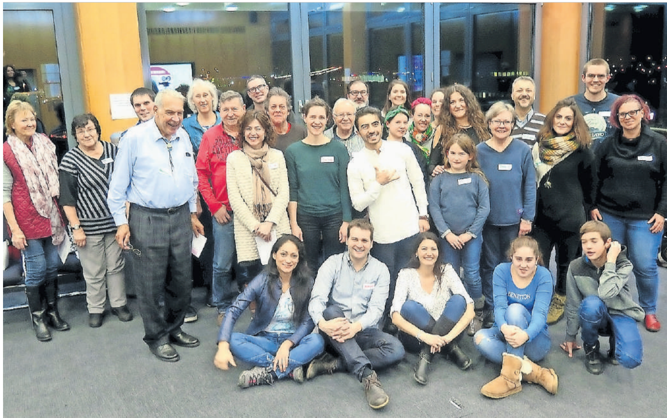
Die Klotenerinnen und Klotener interessierten sich für die im Frühling startende Theaterproduktion.

Der Stadtrat hat den Finanzplan 2018–2021, samt Investitionsprogramm, zur Kenntnis genommen. Der Planung wird ein Steuerfuss von 105 Prozent zugrunde gelegt.