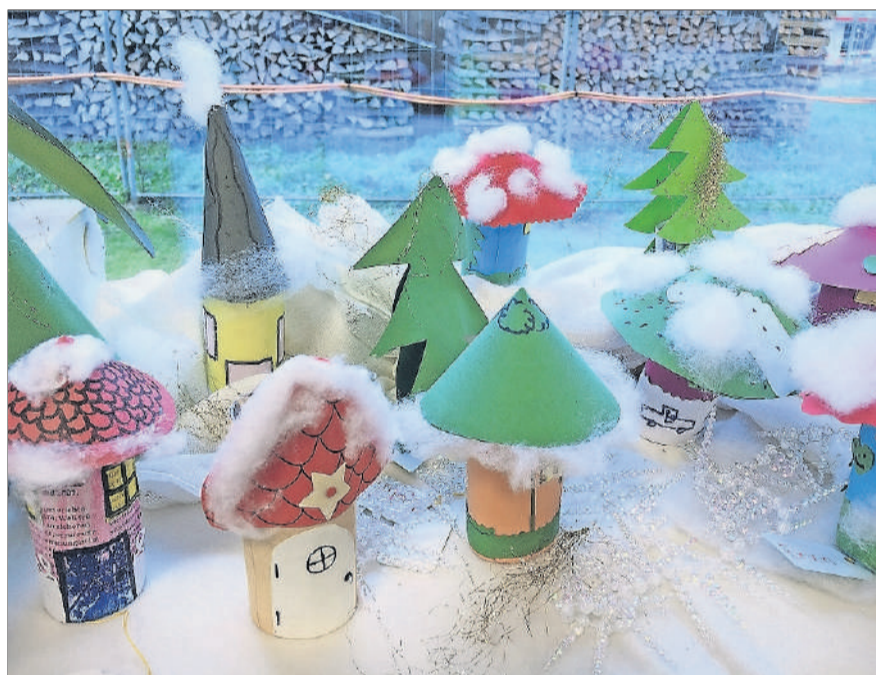
Im Kindergarten Feld 1 entstand das Projekt «Adventskalender».

Weitere Informationen und Anmeldung: www.kloten-packt-aus.ch