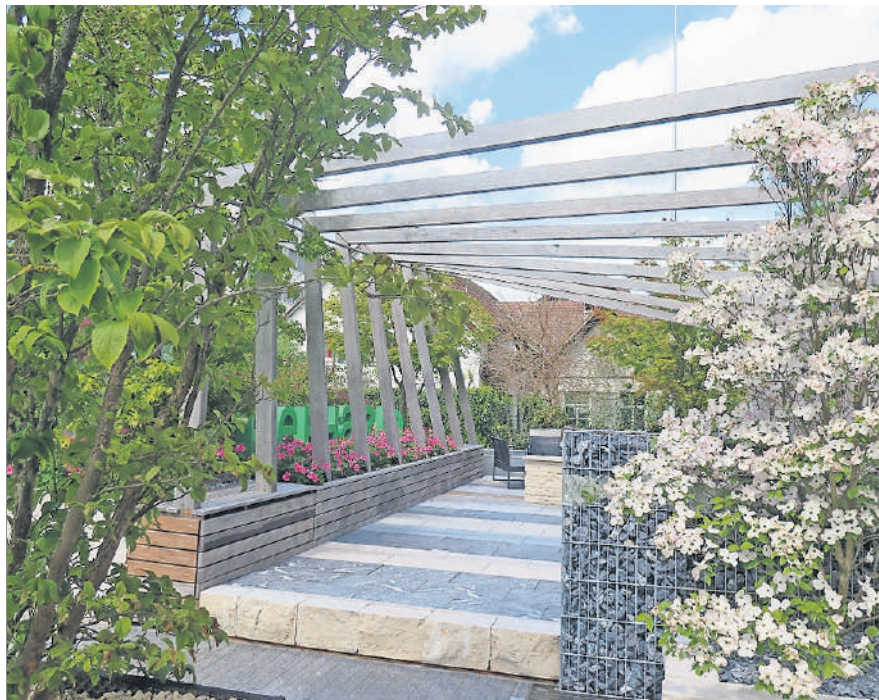
Mai: Gartenausstellung Artgarden auf dem Stadtplatz.

Der Stadtrat und die Mitarbeitenden der Stadt Kloten wünschen allen Klotenerinnen und Klotener einen guten Rutsch und ein gesundes und glückliches neues Jahr.