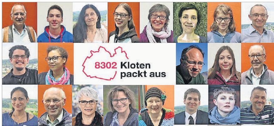
August: 100 Klotenerinnen für Theaterspektakel gesucht.