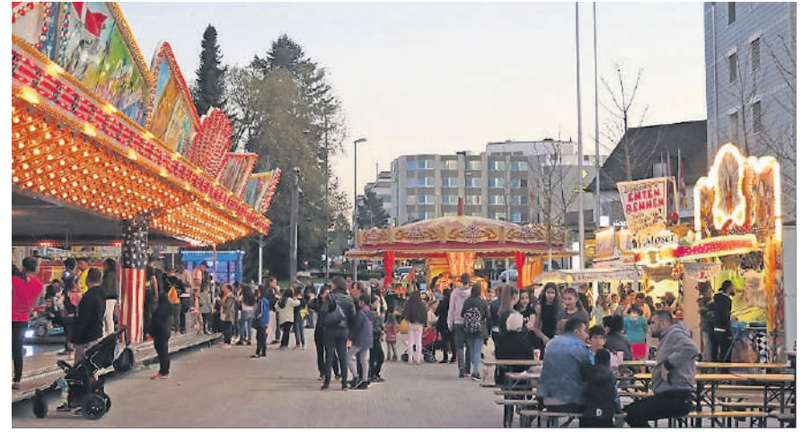
April: Osterhilbi auf dem Stadtplatz.

Der Stadtrat und die Mitarbeitenden der Stadt Kloten wünschen allen Klotenerinnen und Klotener einen guten Rutsch und ein gesundes und glückliches neues Jahr.