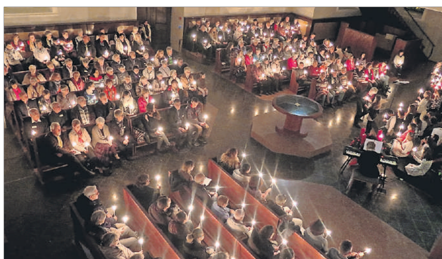
Dezember: Die Stadt dankt den freiwilligen Helfern.