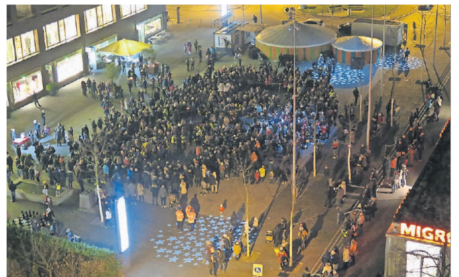
November: Räbeliechtli-Umzug mit den Kindergärtnern.