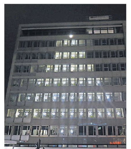
Dezember: Neue Beleuchtung.