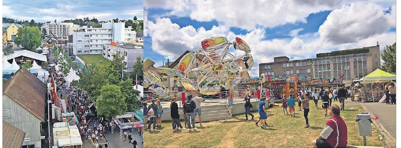
Juli: Ein vielfältiges Stadtfest begeistert während dreier Tage Tausende Besucher.