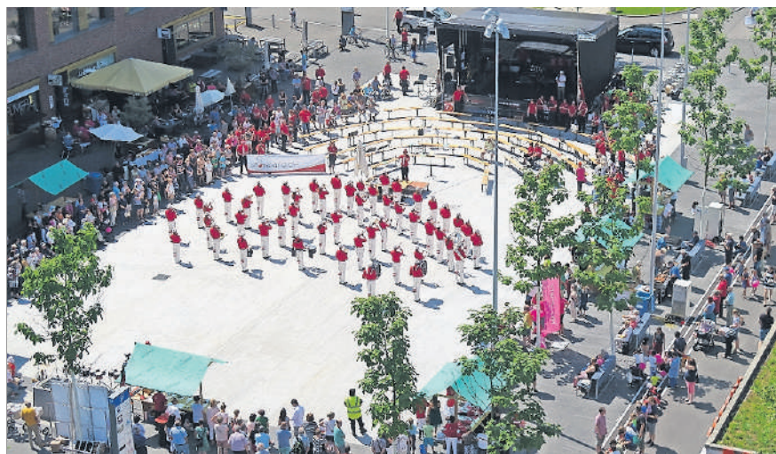
Juni: Musiknetz goes Stadtplatz.

Die Stadt Kloten bietet für die Papier- und Kartonsammlung auch einen kostenlosen SMS-Erinnerungsdienst an. Mit diesem Dienst werden die Abonnenten jeweils einen Tag vor der Sammlung erinnert. Zum Abonnieren des Service: START KLOTEN PK an die Nummer 723 Zum Abbestellen des Service: STOP KLOTEN PK an die Nummer 723