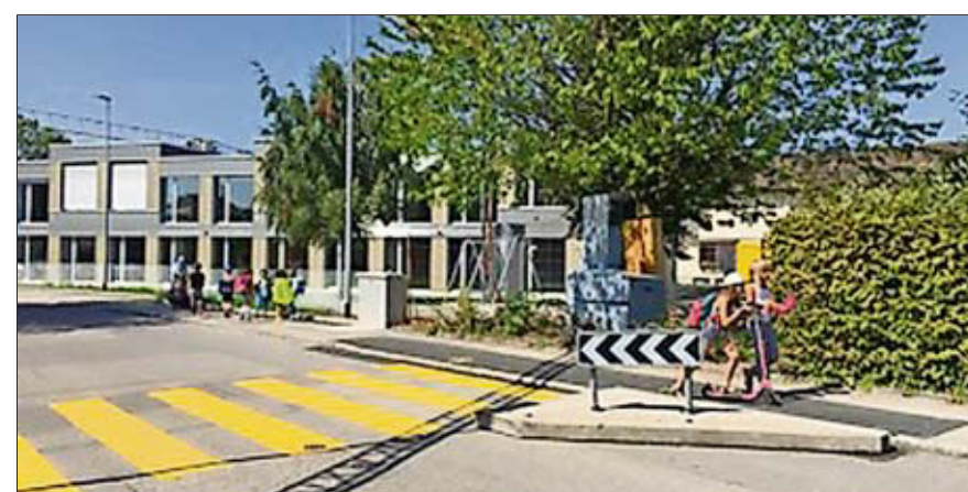
Messung der Stadtpolizei zeigt: 55 Prozent der zu schnell fahrenden Automobilisten fuhren während der Schulzeit am Schulhaus vorbei.

Die semistationäre Anlage steht seit fünf Tagen vor Schulbeginn an der Gerlisbergstrasse neben dem Fussgängerstreifen. Bis zum 24. August wurden insgesamt 16 021 Fahrzeuge gemessen. 574 Fahrzeuglenker und -lenkerinnen wurden in dieser Zeit wegen Überschreitens der signa-