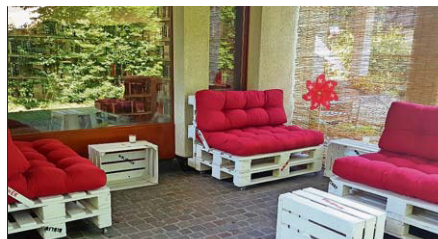
Die gemütlich eingerichtete Gartenlounge in der Stadtbibliothek.

Eine Bibliothek ist nicht nur ein Ort, an dem man Bücher oder andere Medien bezieht, es soll auch ein Ort des Verweilens und des Austauschs sein. Deshalb haben die Mitarbeitenden der Stadtbibliothek die verkürzten Öffnungszeiten während den Sommerferien kreativ genutzt und eine gemütliche Gartenlounge eingerichtet. Einfache Holzpaletten wurden zusammengeschraubt, angemalt und mit Kissen ausgestattet. Auf diesen können die Kunden in Büchern und Zeitschriften schmökern, einen Kaffee oder Tee trinken, plaudern oder das hoffentlich schöne Wetter geniessen.