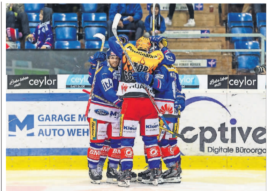
Ab sofort gibt es für Klotener Gratis-Tickets für einen Match.

Weitere Tanznachmittage im Schluelfweg: Mittwoch, 8. November, Mittwoch, 13. Dezember.