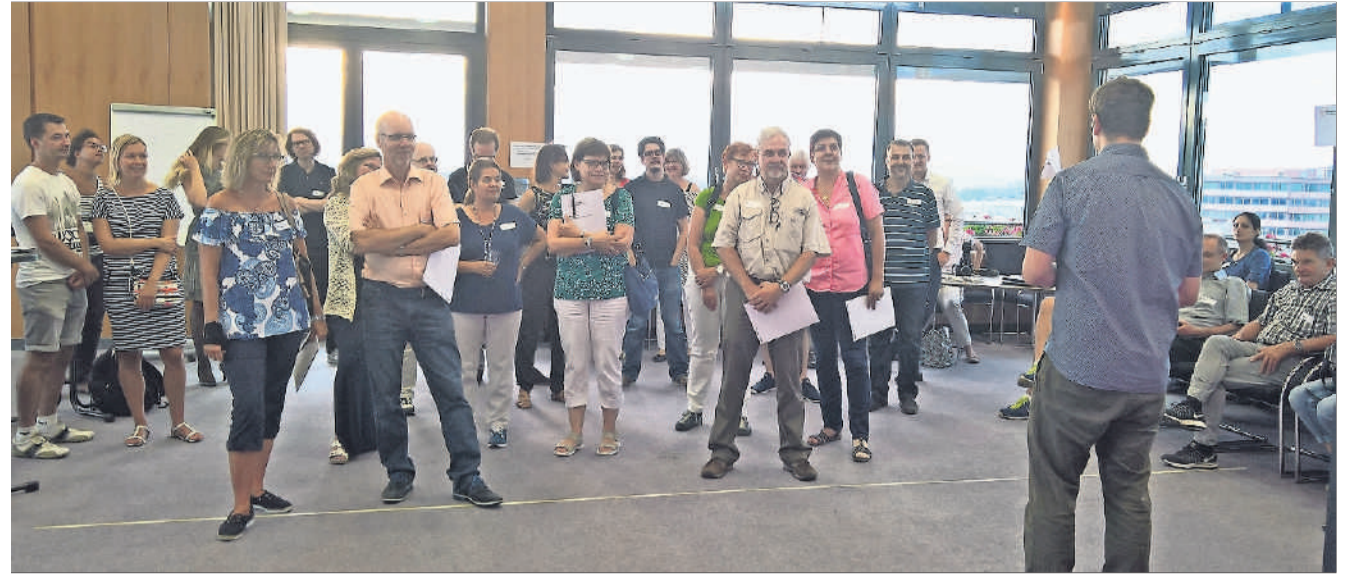
Sollen die Vielfalt Klotens dokumentieren: Interessierte am Kick-off-Abend im Stadthaus.

«Kloten packt aus» wird im Mai 2018 im Stadtsaal aufgeführt. Das Theaterprojekt wird aufrütteln, bewegen und soll vor allem eines: Die Stadtbevölkerung zusammenschweissen und ihre Identität aufzeigen. Gesucht sind 100 Personen aus Kloten: vom Kleinkind bis zum Rentner; Mamis, Papis, Teenies, Kids, Küchenchefs, Swiss-Pilotinnen, Büroangestellte, Gärtnermeister, Dorforiginale, Maler, Mechaniker, Lehrperson, Eishockey-Profis, Pflegefachleute, Lottomillionäre, in Kloten Geborene und aus dem Aus-