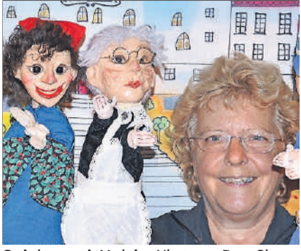
Spielt zwei Mal in Kloten: Der Chasperli in der Bibliothek.