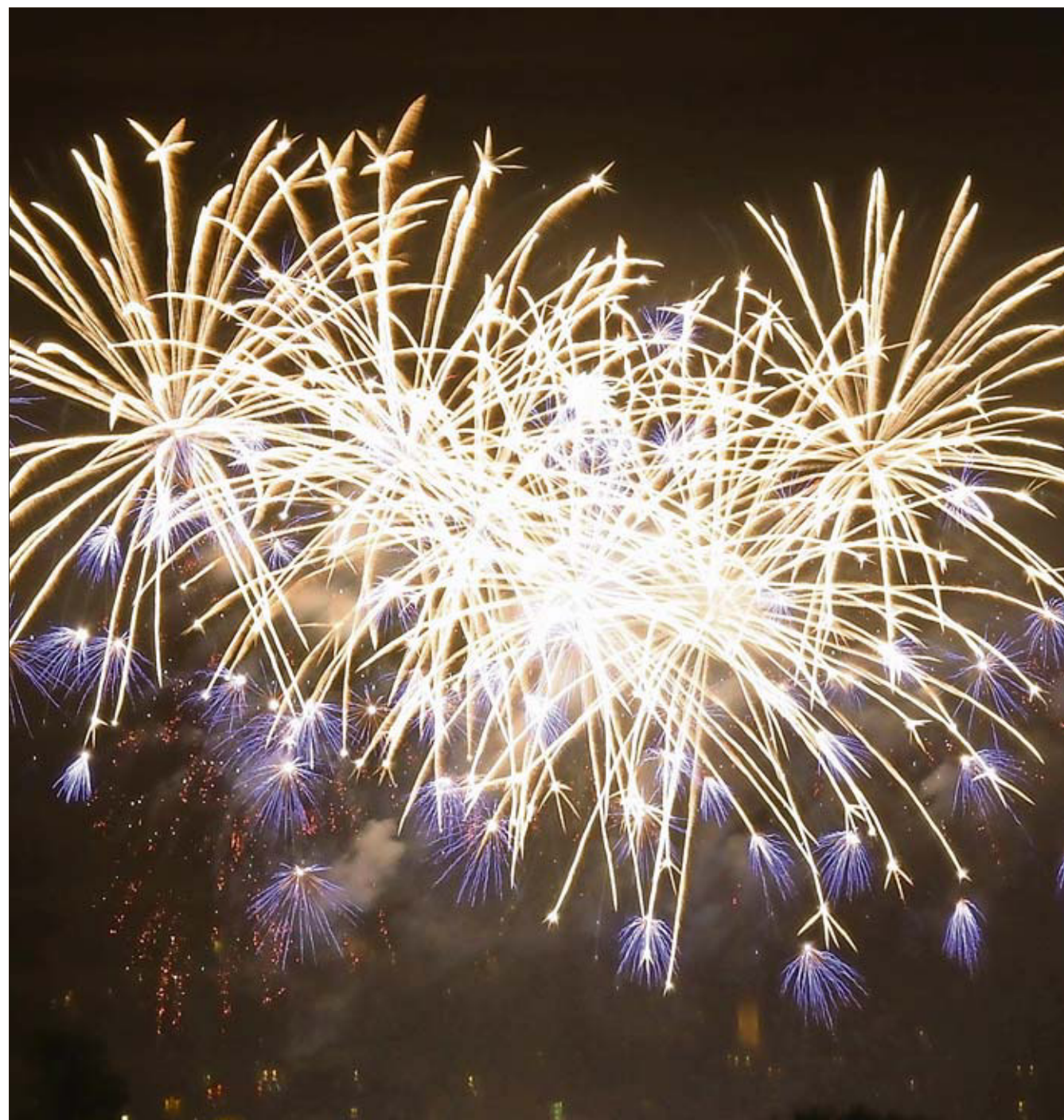
Dürfte erneut zum optischen Höhepunkt der 1.-August-Feier werden: Das Feuerwerk am 1. August.

Weitere Informationen: Flyer mit Klotener Stadthymne und Schweizerpsalm.