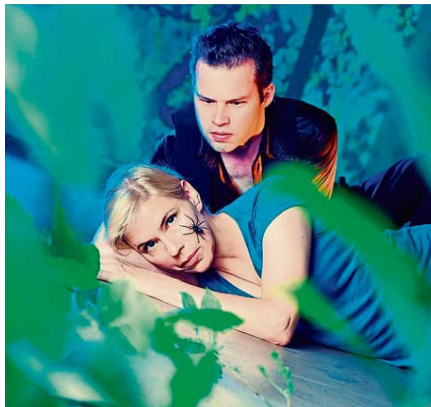
Das Theater für den Kanton Zürich führt auf dem Stadtplatz Jeremias Gotthelfs Klassiker «Die schwarze Spinne» auf.

Mit der Ausführung der Pfosten-Riegel-Glasverkleidung wird die Firma Zehnder Holz und Bau AG in Winterthur mit 181 364 Franken beauftragt.