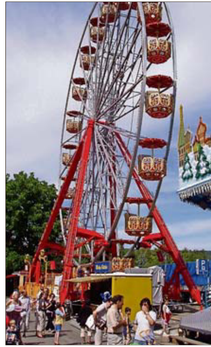
Darf am Stadtfest nicht fehlen. Das Riesenrad.

Ein regelrechtes Kinderparadies wird hinter dem reformierten Kirchgemeindehaus geboten. Dort können sich kleine und grössere Besucher stundenlang verweilen. In der grossen Spiel-Oase der Vereinigung Freizeit Kloten dürfen sich Kinder und Jugendliche bei Openair-Billard, Jöggeli-Turnieren oder beim Kegeln amüsieren. Kleine Künstler können im Zelt vom Müttertreff nach Lust und Laune basteln. Zusätzlich lädt die Gumpimatte der Tagesfamilien