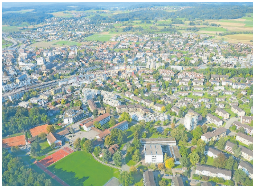
Entscheide über zwölf Bauvorhaben in der Stadt Kloten.