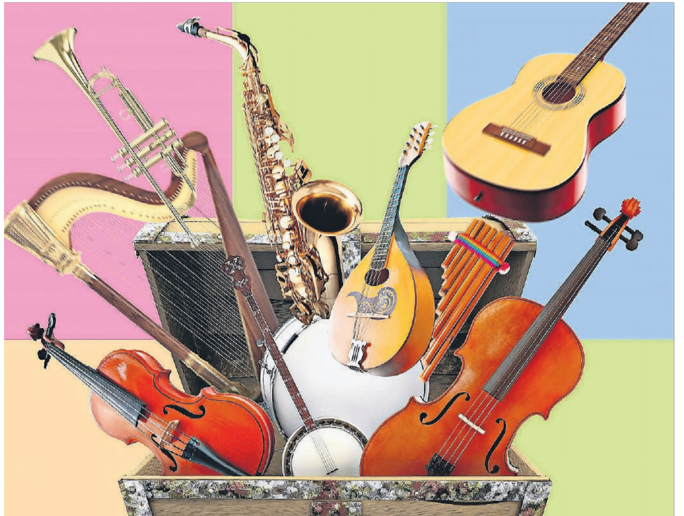
Die Wunderkiste öffnet sich und diverse Musikinstrumente werden an der Musikschule vorgestellt.

Weitere Informationen: www.musikschule-kloten.ch