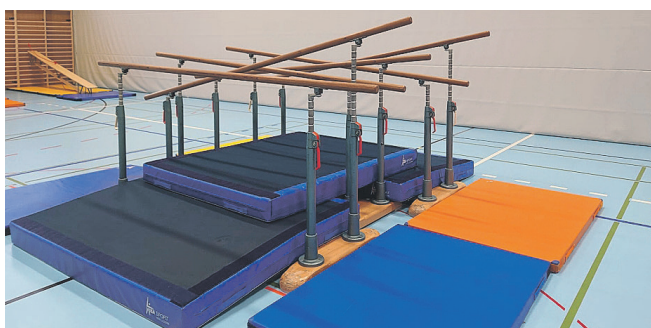
Schülerinnen und Schüler der Unterstufe erlebten ein Bewegungsmorgen voller Spass und Action.