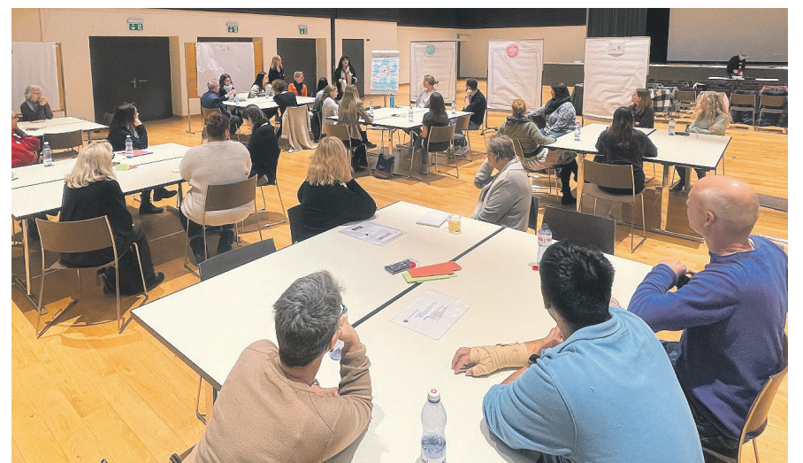
Im Workshop wurden das bestehende Angebot in Kloten analysiert und Ideen für weitere Entwicklungsschritte gesammelt.

Im anschliessenden von Elsbeth Fässler, Bereichsleiterin Einwohner + Soziales, mode-