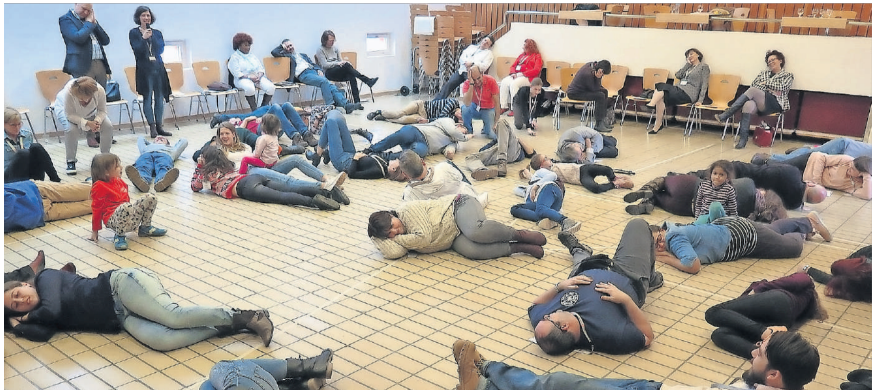
Einige Alltagssituationen werden dargestellt. Begegnungen, Tanz und auch simulierte Ruhepausen.