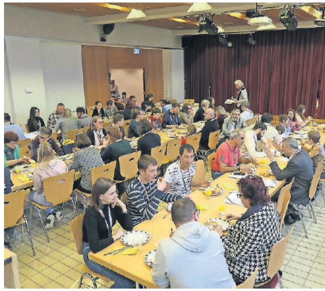
Kick-off-Brunch: Wer arbeitet, braucht auch Nahrung.

Ein ganzer Tag mit Spielen, Musik, Tanz, Begegnungen, Brunch und einer sehr guten Stimmung. Danke allen 100 Teilnehmenden für die vielen schönen Momente. Einige Impressionen vom Startschuss.