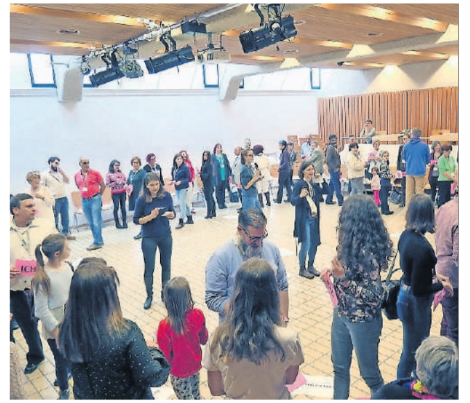
Am Anfang braucht es einige Anweisungen.